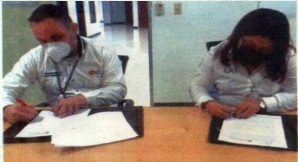
PARTICIPACIÓN ESTARÁ abierta a estudiantes de las dos carreras que se imparten en esa dependencia universitaria

LG Electronics es un innovador global en tecnología y bienes de consumo con presencia en casi todos los países del mundo y una fuerza laboral diversa de 74,000 personas. Es un fabricante líder de una amplia gama de productos: televisores, lavadoras, refrigeradores, aire acondicionado, dispositivos móviles, señalización digital y componentes automotrices.