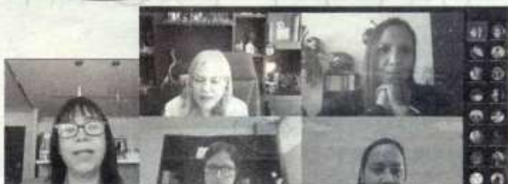
REALIZAN PANEL sobre protocolos para atender violencia de género

para la Igualdad entre Mujeres y Hombres de la Universidad Autónoma de Sinaloa.