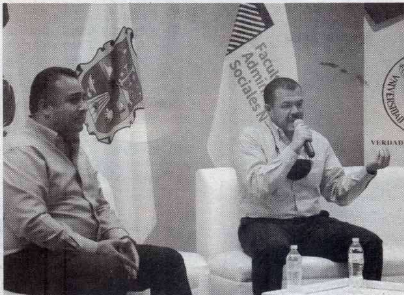
EL RECTOR electo se reúne con los universitarios