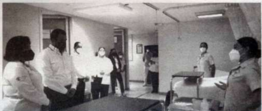
LA COMUNIDAD estudiantil de la UAT en Nuevo Laredo recibió al rector electo