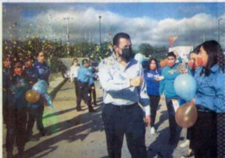
El rector electo saludó a jóvenes universitarios.

Señaló que entre las bases de su plan de trabajo es prioridad estar cerca de los estudiantes y escuchar sus sugerencias para mejorar la oferta de la Universidad.