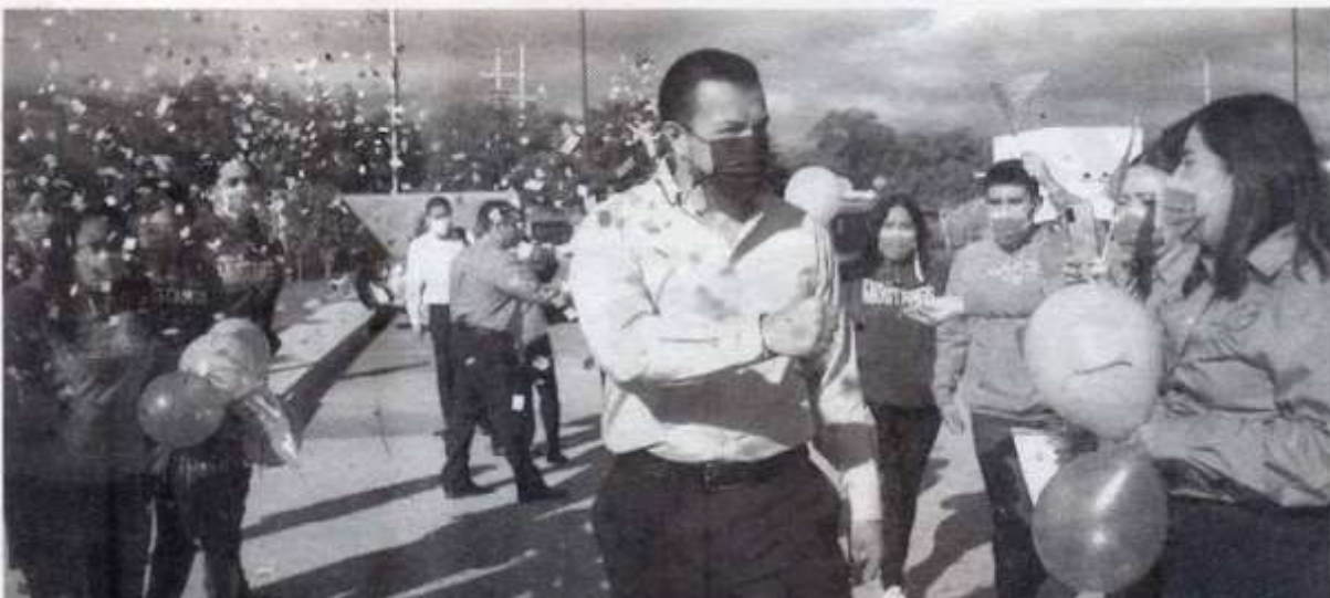
VISITA RECTOR electo la Prepa Tres de la Universidad

Finalmente se reunió con docentes, quienes le presentaron un panorama general del estado que guarda la Preparatoria en materia educativa, así como los proyectos educativos que habrán de emprenderse a mediano y largo plazos.