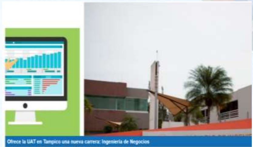
Ofrece la UAT en Tampico una nueva carrera: Ingeniería de Negocios El programa educativo consta de nueve periodos académicos que abarcan áreas de formación en: administración, gestión empresarial, economía y finanzas, gestión de la calidad, gestión de la producción, negocios, logística, tratamiento de información, programación e ingeniería de software, investigación de operaciones, servicios sociales y comunitarios.