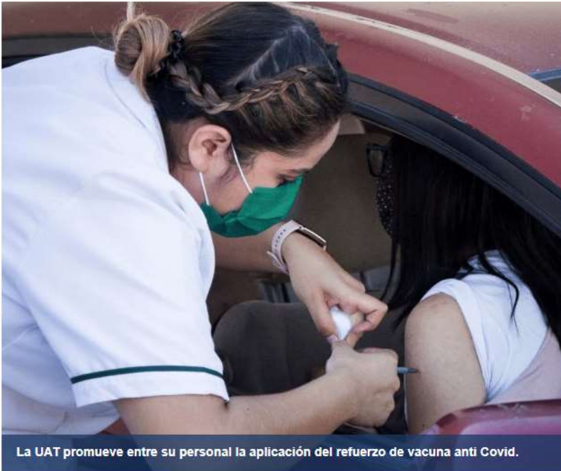
La UAT promueve entre su personal la aplicación del refuerzo de vacuna anti Covid.

La Universidad Autónoma de Tamaulipas (UAT) promueve entre su personal la Jornada de Refuerzo de Vacunación COVID-19 para los trabajadores de la educación de todo el estado, la cual se lleva a cabo del 17 al 21 de enero de 2022.