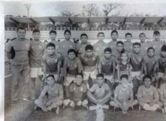
Los niños también han sido de presencia.