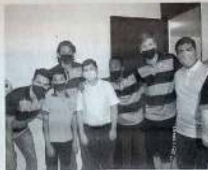
La fotografía del recuerdo va por la labor.