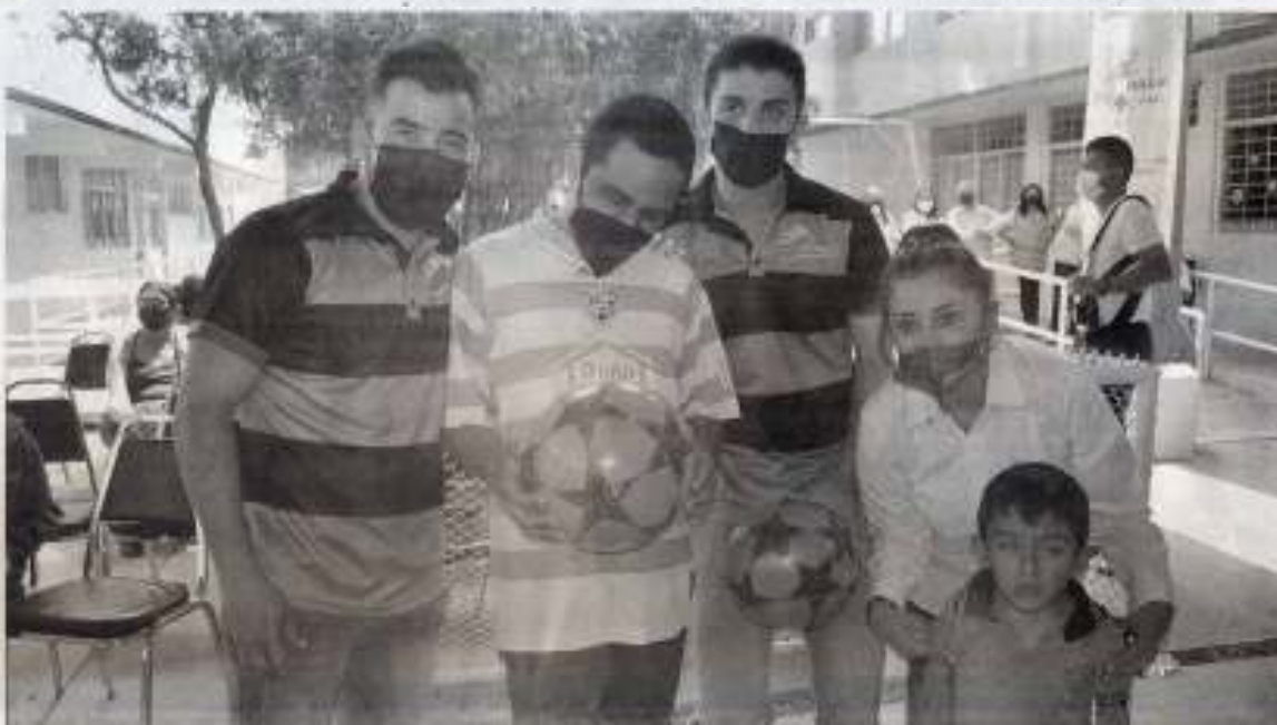
Correccaminos estuvo presente en el CAM Tamaulipeca para el cierre del mes de la Educación Especial.

Entre las actividades estuvieron presentes el secretario de