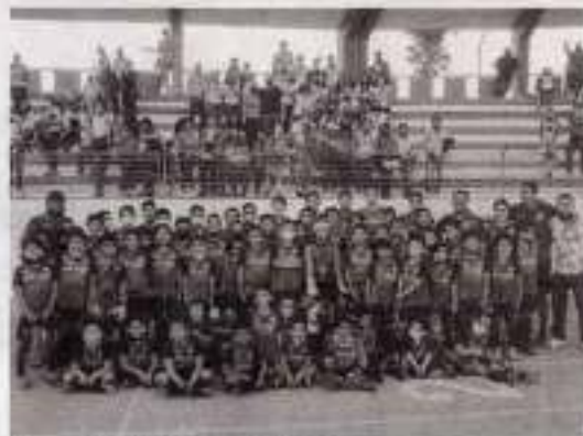
La gran familia de Nuevos Talentos.

Con este evento Copa UAT, arranca la primera jornada del Torneo de Copa y sigue consolidándose como la liga potencia con una trayectoria de más de treinta años en el fútbol infantil.