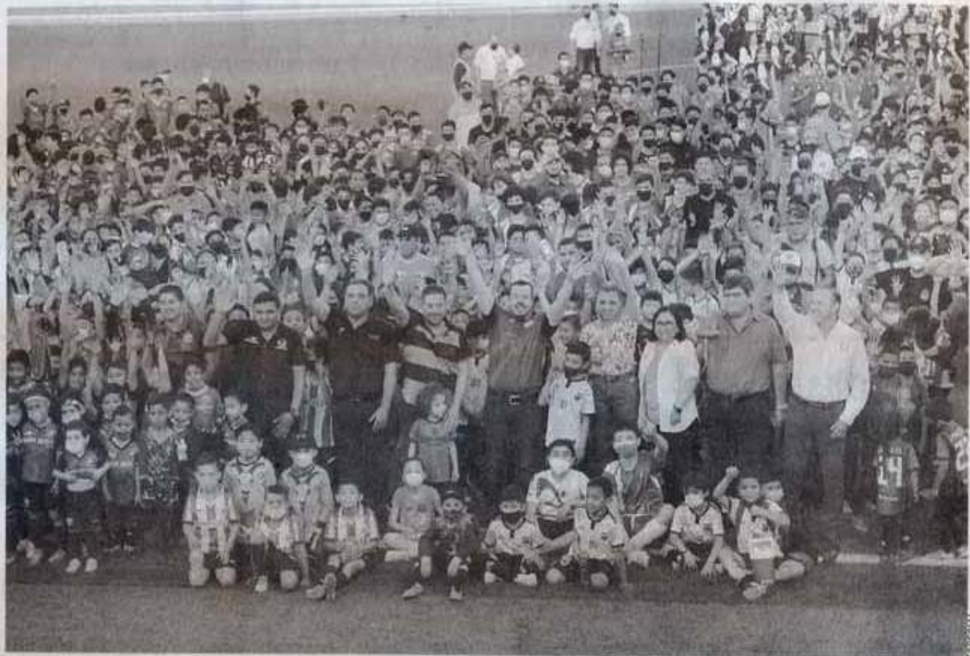
Con gran éxito pusieron en marcha la nueva edición de la Copa UAT.