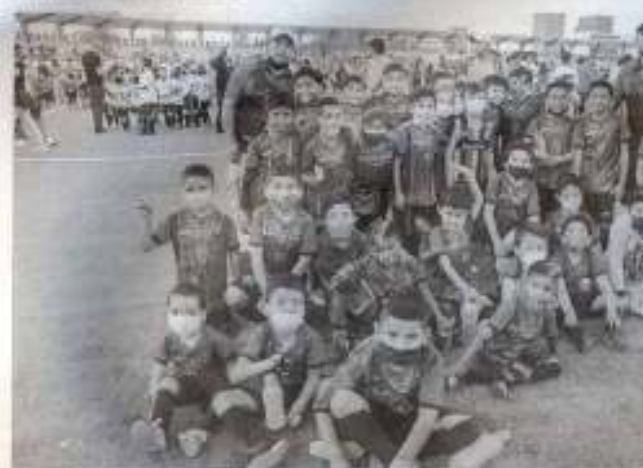
Jugadores del equipo Leones FC.