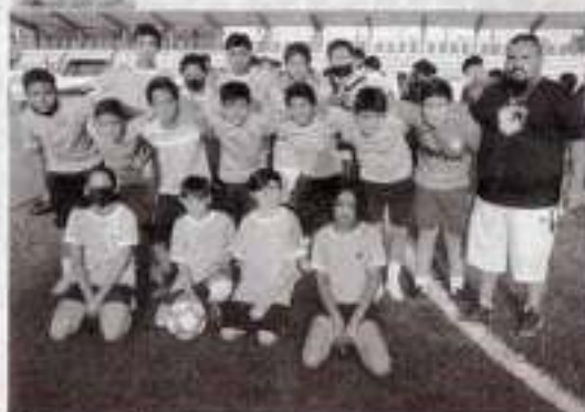
Jaibos Victoria, dijo presente.