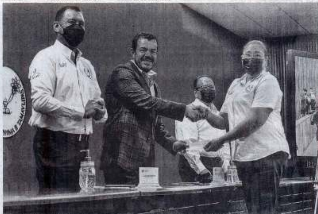
EL RECTOR de la UAT entregó estímulos económicos a hijos de trabajadores de la institución.