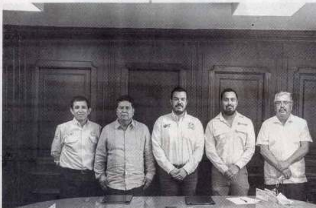
LA FIRMA se celebró en la sala de juntas del edificio de la Rectoría.