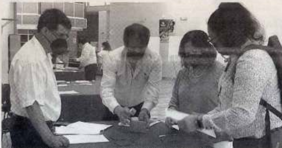
CUMPLE el SUTUAT con legitimación de contrato de trabajo

AGREMIADOS DEL SINDICATO ÚNICO DE TRABAJADORES ACADÉMICOS DE LA UNIVERSIDAD AUTÓNOMA DE TAMAULIPAS VOTARON POR CUMPLIR CON ESTA MODALIDAD EN LA NUEVA REFORMA LABORAL