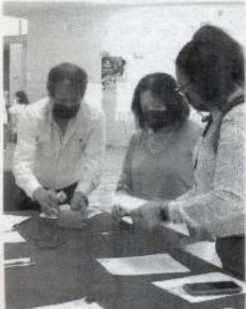
PIE DE FOTO El procedimiento fue realizado simultáneamente en siete sedes de la UAT en el estado