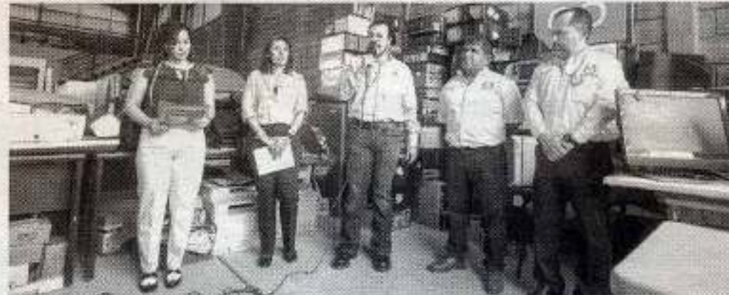
ARRANCA RECTOR la campaña "Transformemos nuestros residuos en nuevos recursos"

Y en ese sentido indicó también que se fomenta entre la comunidad universitaria la cultura de reci-