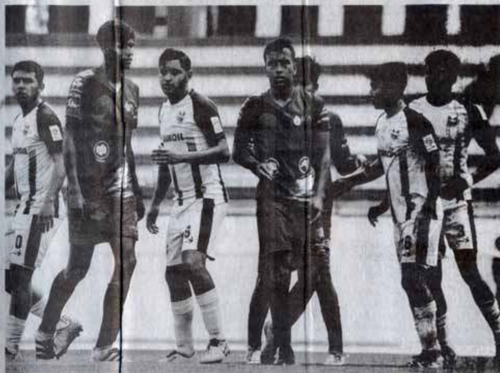
LOS MINEROS de Reynosa cayeron en el último minuto ante los Correcaminos UAT.