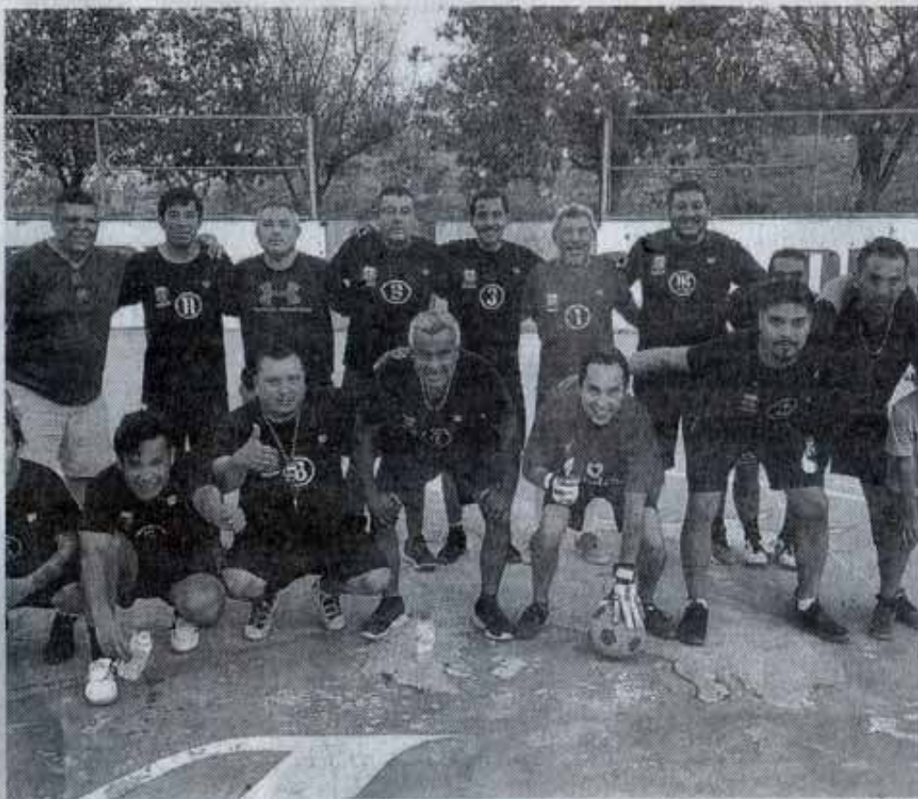
PEDACERA-UAT comparte liderato con SUTUAT en el torneo de futbol rápido.