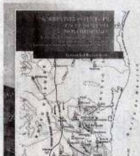
SOBREVIVIR o fenecer en el noreste novohispano, es la edición que promociona la UAT.

Por eso, es de celebrar la reciente publicación del libro del Dr. Fernando Olvera Charles Sobrevivir o fenecer en el noreste novohispano . Estrategias de los indios ante la colonización y su incidencia en el comportamiento de la resistencia nativa en Nuevo Santander, 1750-1796; publicado por El Colegio de San Luis y la UAT a través del Instituto de Investigaciones Históricas,