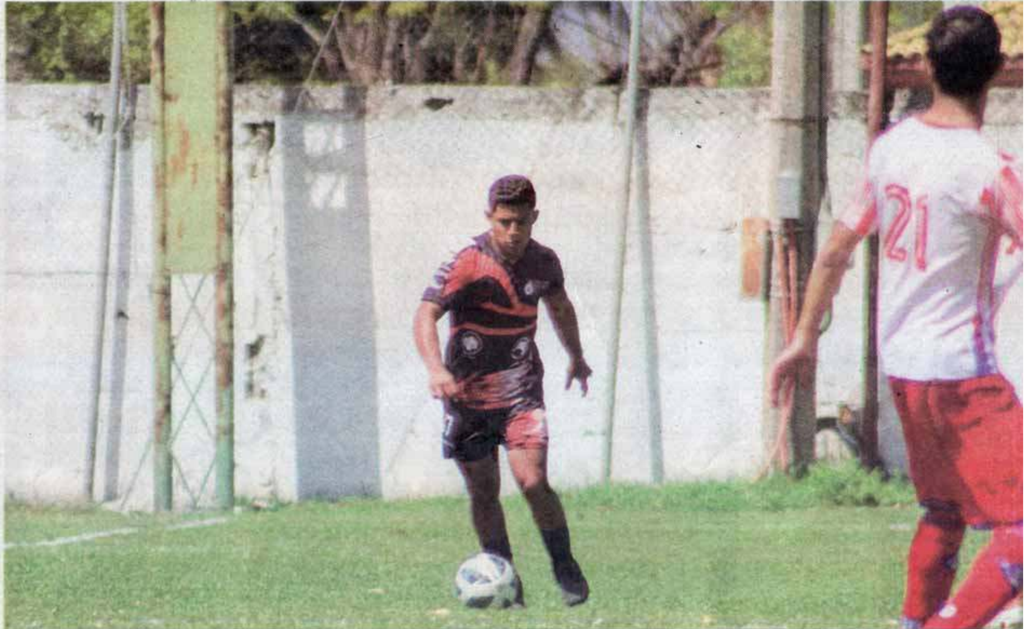
Correcaminos TDP jugará en el Estadio Universitario, el día de mañana contra Guerreros Reynosa.