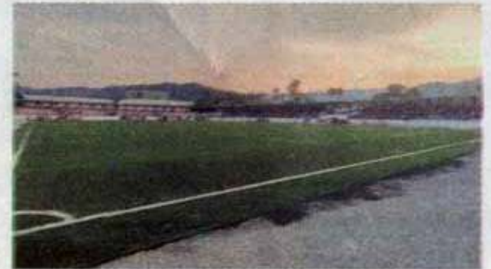
La cancha sintética del "Eugenio Alvizo Porras".

Por su parte a la afición envió el siguiente mensaje, "muchas gracias por estar al pendiente