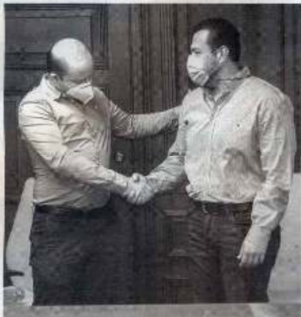
UAT y CRIT Teletón trabajan para beneficiar a la comunidad universitaria y a familias tamaulpecas