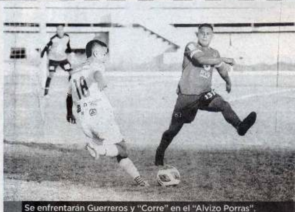
Se enfrentarán Guerreros y "Corre" en el "Alvizo Porras".