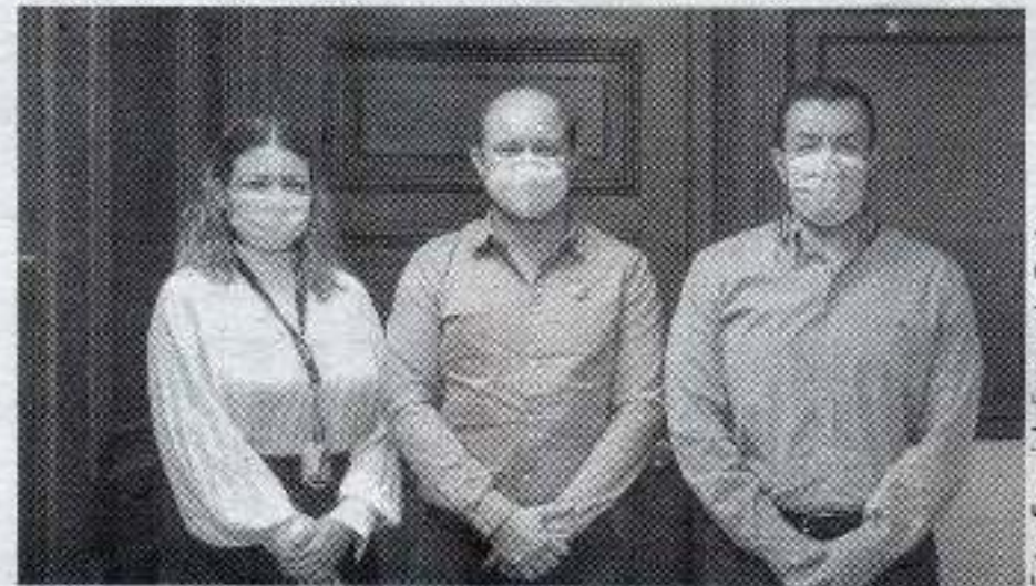
BUSCAN ESTRATEGIAS de colaboración UAT y CRIT-Teletón

Como parte de las estrategias que se prevén en esta colaboración, se busca ofrecer capacitación y apoyo escolar a personal docente y administrativo de las diversas guarderías y centros infantiles de la UAT, con el fin de sensibilizar a la inclusión y atención de las personas con discapacidad en esos centros educativos.