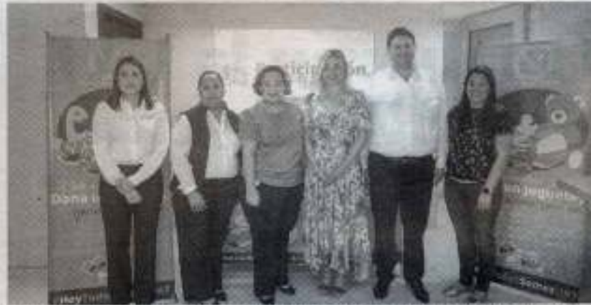
REALIZARON LA entrega de donativos dentro de la colecta del programa Corazón de Niño