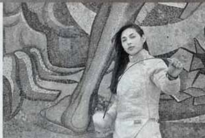
Karate, Judo, Lucha y Esgrima son las disciplinas que ya tienen fecha y sede de competencia.