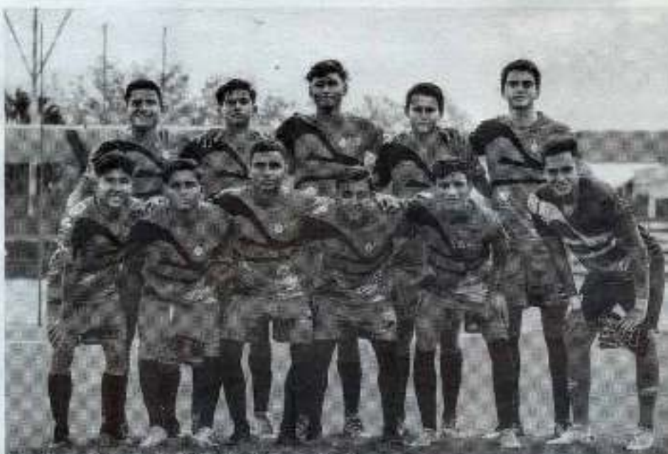
Correcaminos TDP se enfrenta a la Fiesta Grande.

CORRECAMINOS SE PRESENTÓ CON UN TRIUNFO EN EL REMODELADO ESTADIO UNIVERSITARIO, IMPONIÉNDOSE 2-1 SOBRE GUERREROS REYNOSA, EN LA TERCERA DIVISIÓN