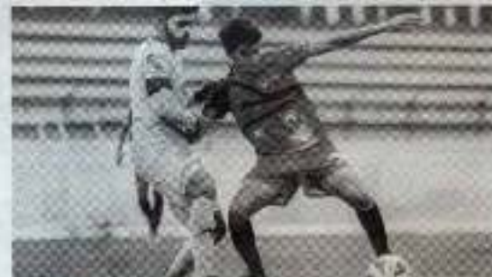
Los locales impusieron condiciones

El segundo gol para los locales llegó al minuto