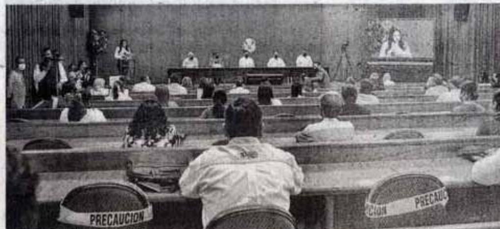
TRABAJADORES universitarios reciben capacitación dentro del programa "Hoy todos somos UAT".