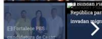
Bundan Plaza República para o invadan migran