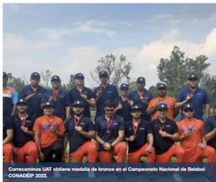
Correcaminos UAT obtiene medalla de bronce en el Campeonato Nacional de Beisbol CONADEIP 2022.