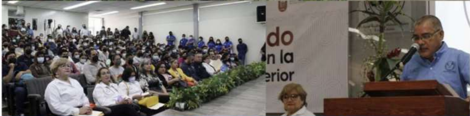
Realiza UAT ciclo de conferencias "Conociendo de inclusión en la educación superior"