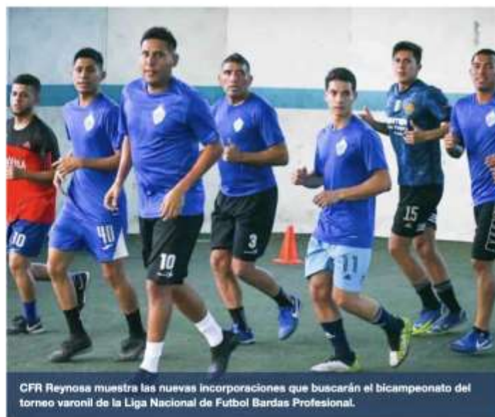
CFR Reynosa muestra las nuevas incorporaciones que buscarán el bicampeonato del torneo varonil de la Liga Nacional de Futbol Bardas Profesional.