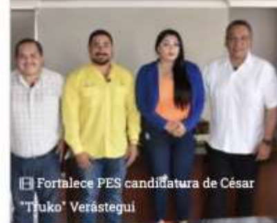
Fortalece PES candidatura de César "Truko" Verástegui