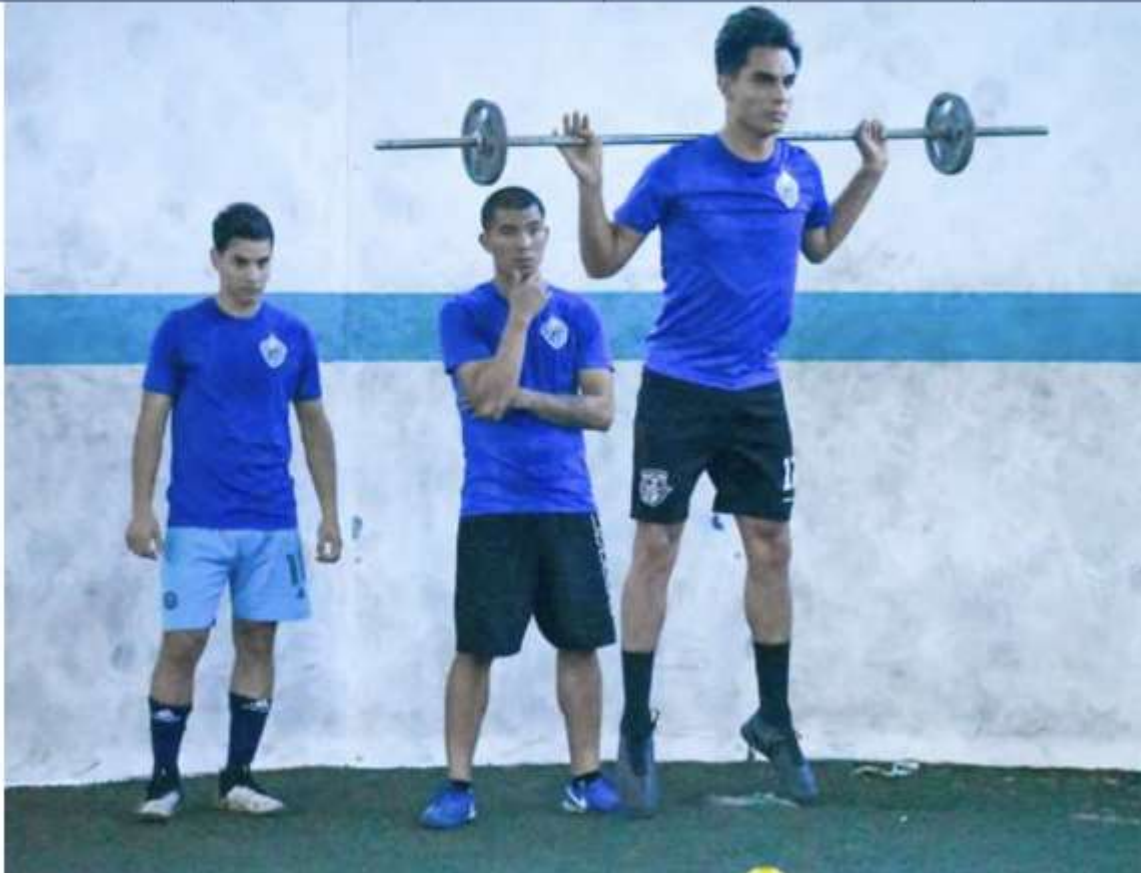
Con intensos ejercicios se prepara el conjunto reynosense que hoy sostiene partido de preparación ante Valle Hermoso.