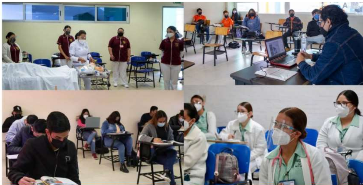
Inicia UAT el retorno gradual y seguro a las clases presenciales

INICIO LA CIUDAD LA REGIÓN NACIONAL INTERNACIONAL VIRAL STILO ESCENARIOS DEPORTES TECNOLOGÍA OPINIÓN CLASIFICADOS