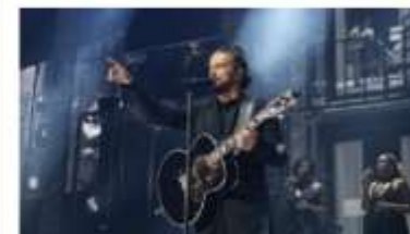
Disfrutan de la música de Arjona