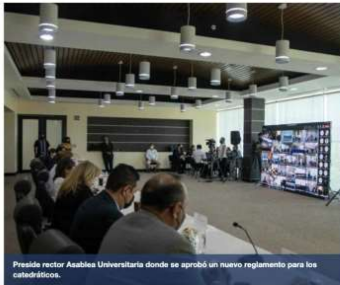
Preside rector Asables Universitaria donde se aprobó un nuevo reglamento para los catedráticos.

POR: EL MAÑANA STAFF 14 / MAYO / 2022 - COMPARTIR