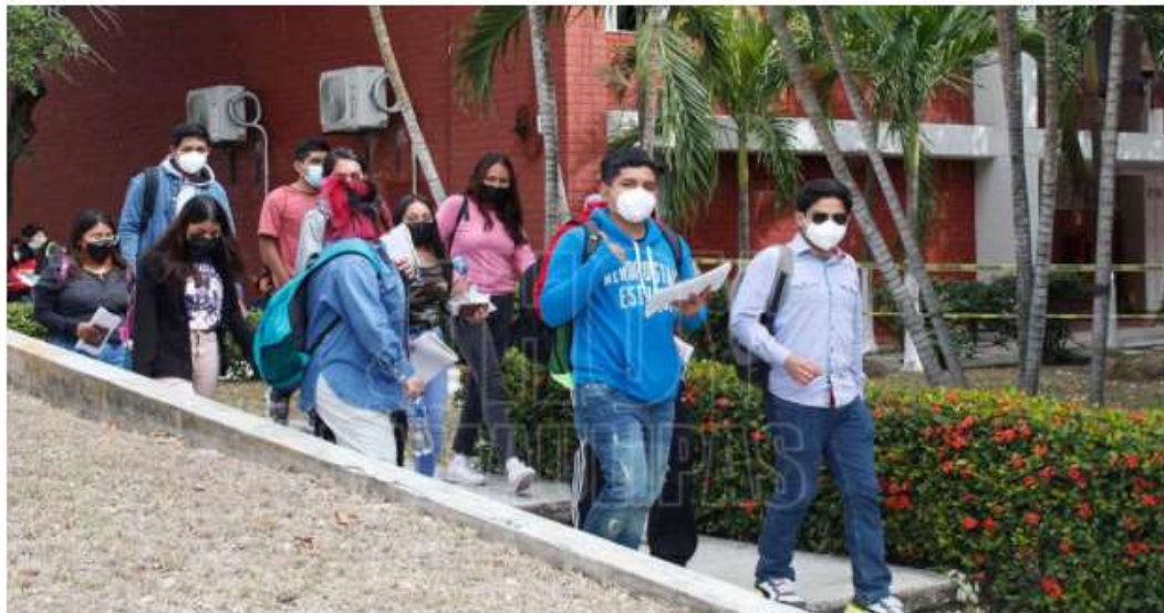
Luego de que facultades, unidades académicas y escuelas de las zonas norte y centro de la Universidad Autónoma

Por: HT Agencia El Día Lunes 14 de Febrero del 2022 a las 16:55