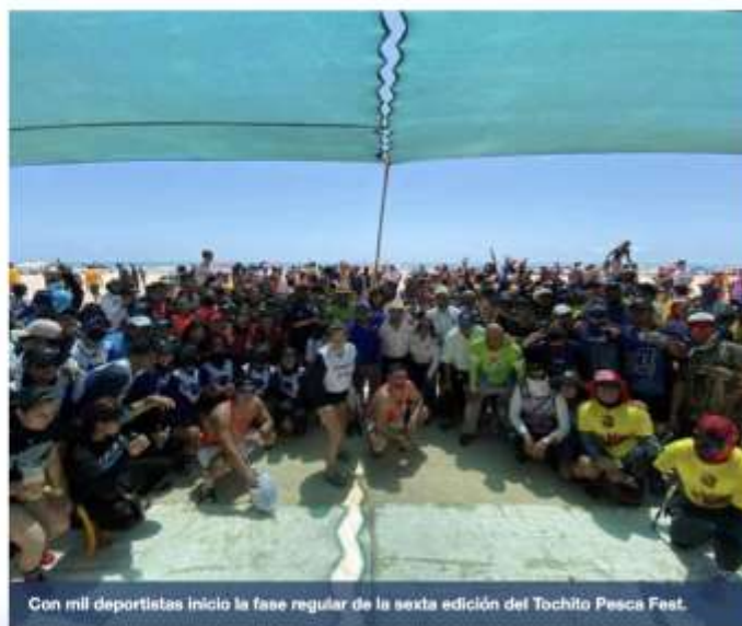
Con mil deportistas inicio la fase regular de la sexta edición del Tochito Pesca Fest.