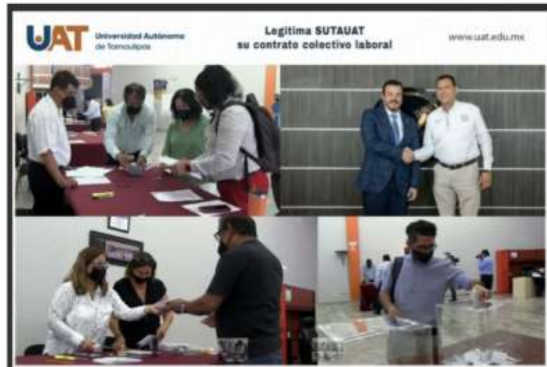
Ciudad Victoria, Tam.; 15 de mayo de 2022.

POSTED BY - EDITOR ON - 15 MAYO, 2022 0 COMMENT