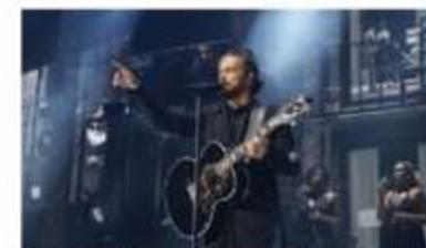
Disfrutan de la música de Arjona