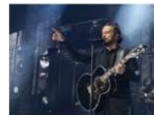
Disfrutan de la música de A