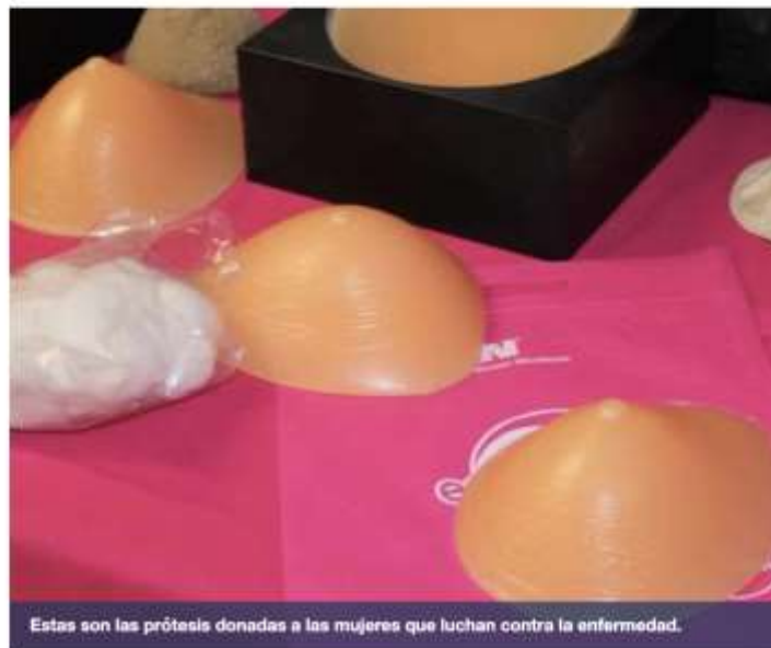
Estas son las prótesis donadas a las mujeres que luchan contra la enfermedad.