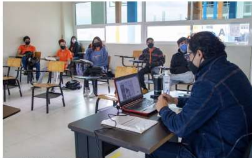
Clases en la Universidad Autónoma de Tamaulipas.

Rector de la Universidad Autónoma de Tamaulipas anuncia beneficios para docentes.