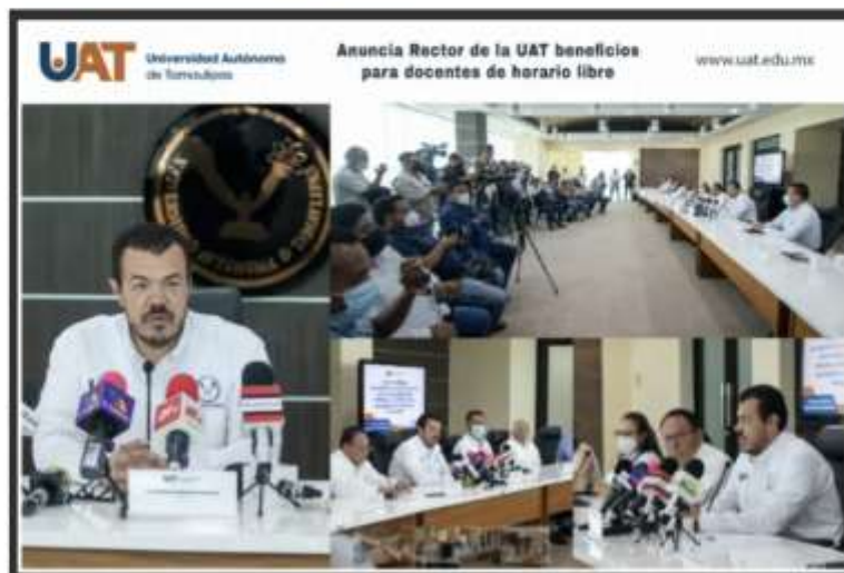
Cd. Victoria, Tam., 16 de mayo de 2022. Anuncia Rector de la UAT beneficios para docentes de horario libre

POSTED BY: EDITOR • ON: 16 MAYO, 2022 • 0 COMMENT