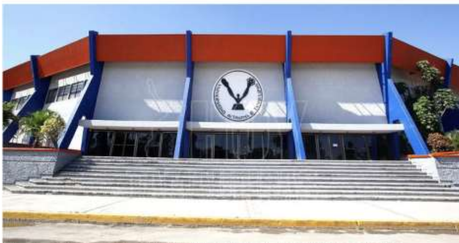
El torneo tendrá lugar en el Gimnasio Multidisciplinario Victoria, los días 3, 4 y 5 de junio de 2022

Por: HT Agencia El Día Martes 17 de Mayo del 2022 a las 17:04