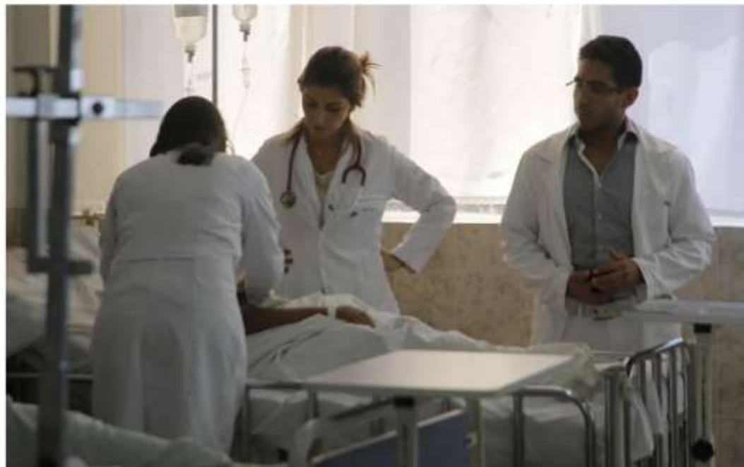
Médicos de Tamaulipas suficientes para cubrir plazas para extranjeros