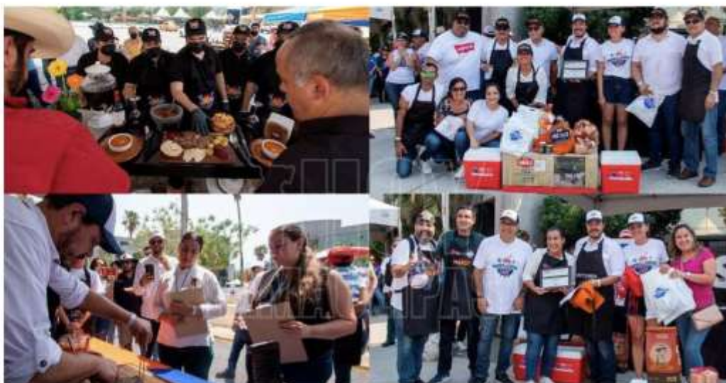
Parrilleros de la UAT en un evento familiar en el que 36 equipos integrados por personal universitario compitieron al exponer su toque y sazón al asador

Por: HT Agencia El Día Sabado 21 de Mayo del 2022 a las 20:48