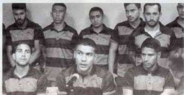
LOS JUGADORES pidieron disculpas a la afición

En lo que respecta a posibles sanciones internas, los jugadores descartaron esa medida, pues ase-