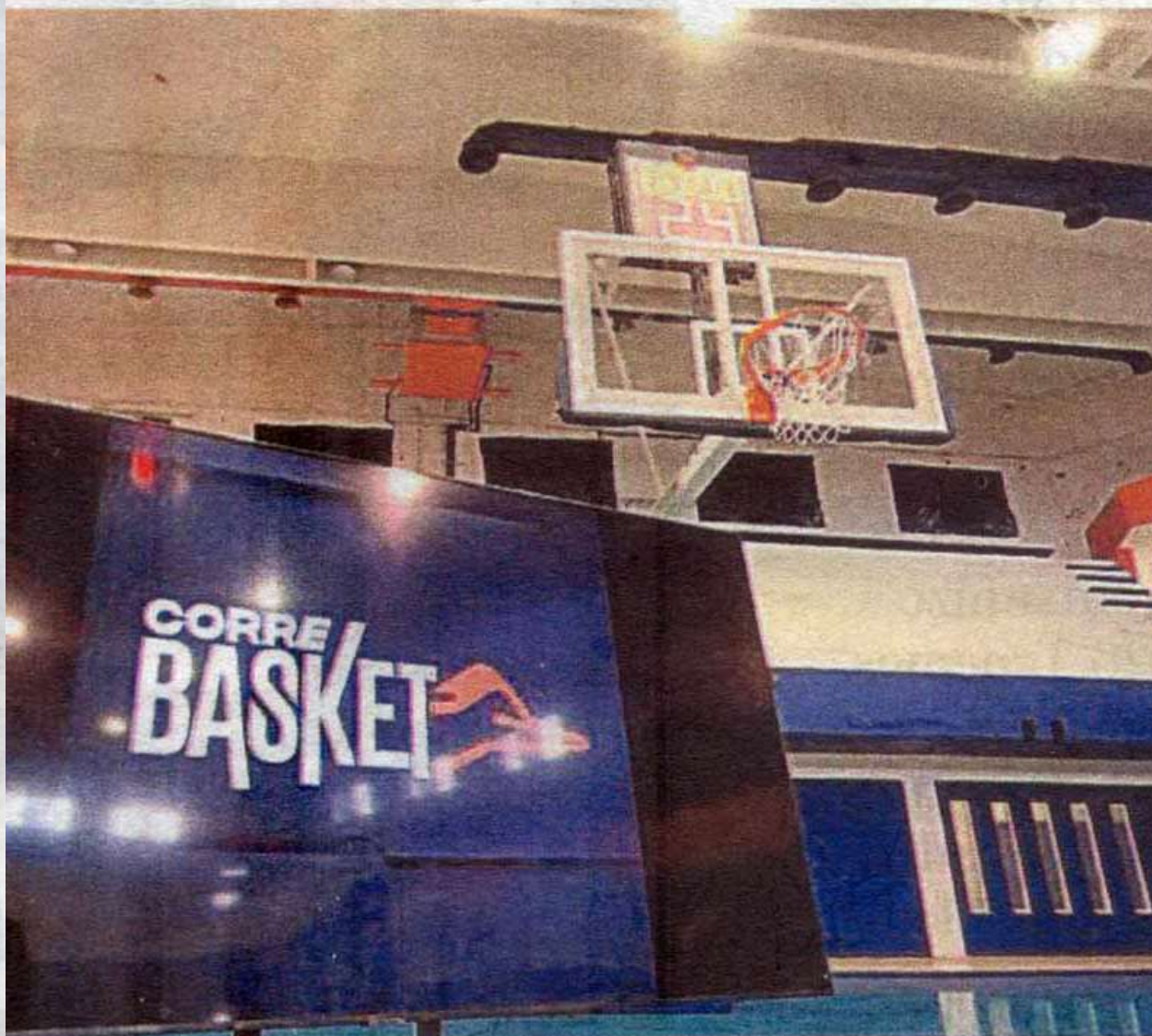
Zona sur como la frontera, se incluyen en plan de la Universidad de contar con otra franquicia en la organización deportiva.