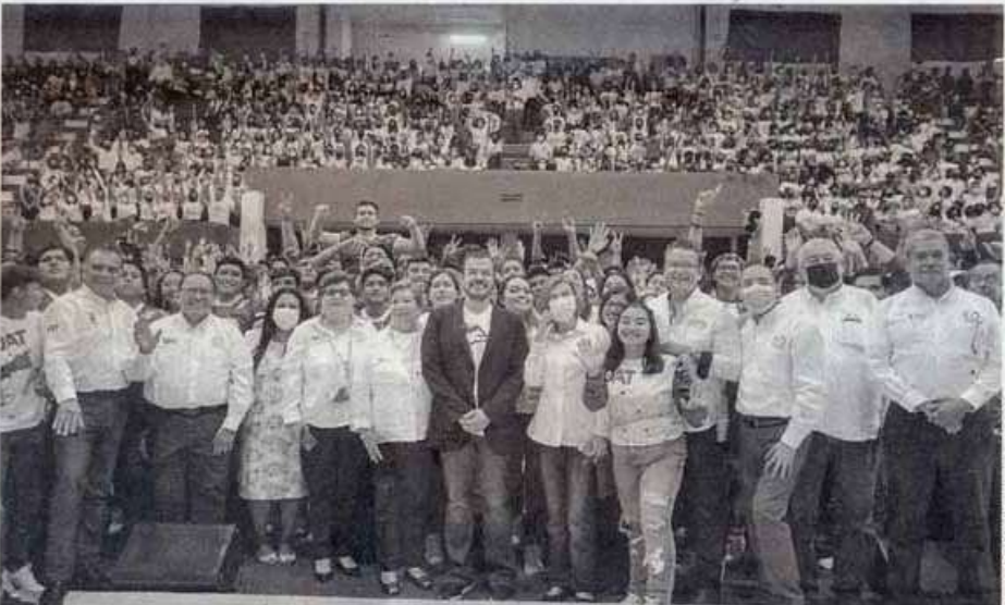
EL RECTOR, C.P. Guillermo Mendoza Cavazos en su gira en el Sur del Estado

Guillermo Mendoza destacó el objetivo de realizar este encuentro de bienvenida para darles a conocer todo el contexto en el cual se van a desenvolver, con el compromiso de crear las mejores condiciones para su formación profesional de manera integral.