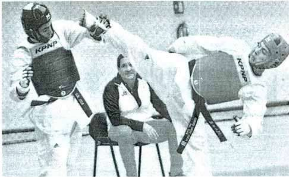
Multidisciplinario UAT Victoria. Por la mañana de 11:00 a 14:00 horas y por la tarde de 17:00 a 19:00, ambos días.

La justa tendrá verificativo este viernes 2 y sábado 3 de septiembre con dos horarios de competencia, en el Gimnasio