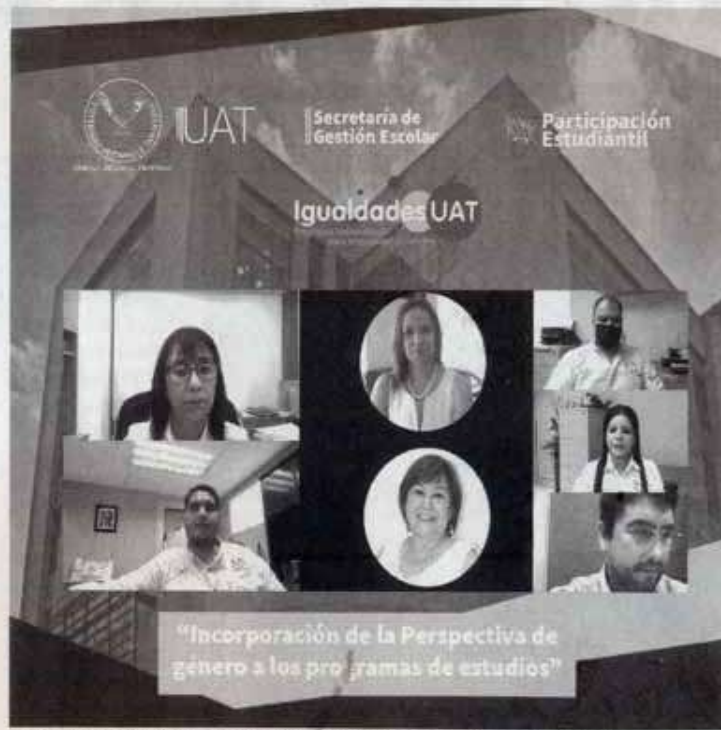
ESTUDIAN METER perspectiva de género en la UAT.

igualdad, y la discriminación contra las mujeres está en todos lados, incluso en la publicidad.