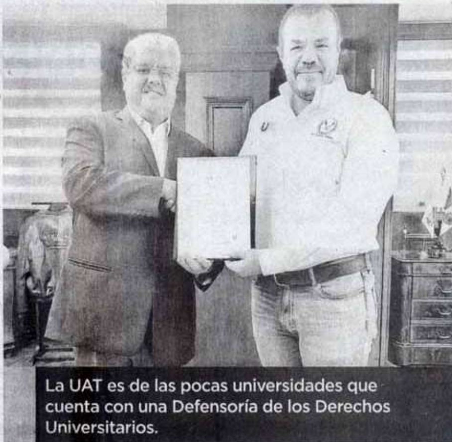
La UAT es de las pocas universidades que cuenta con una Defensoría de los Derechos Universitarios.