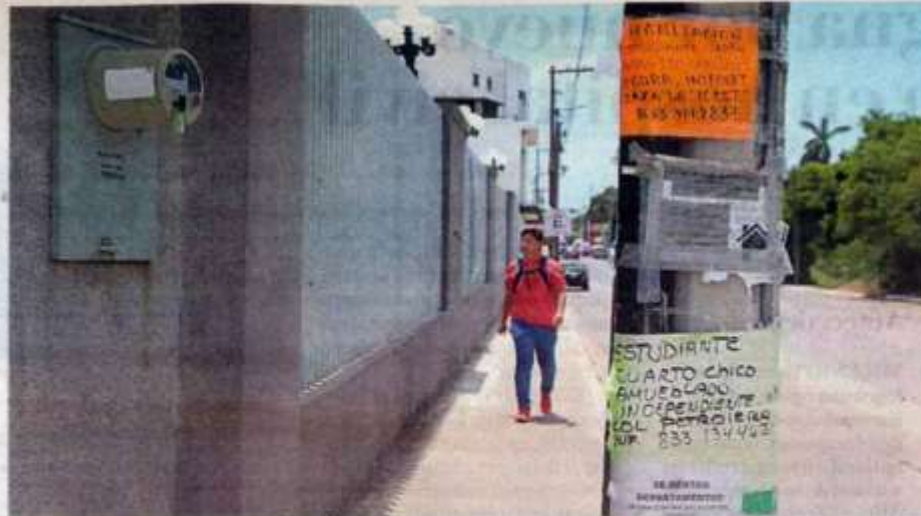
Anuncios cerca de las escuelas ofertan cuartos amueblados para los estudiantes foráneos. ESPECIAL