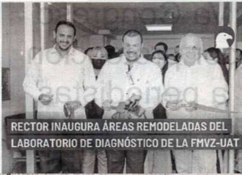
RECTOR INAUGURA ÁREAS REMODELADAS DEL LABORATORIO DE DIAGNÓSTICO DE LA FMVZ-UAT