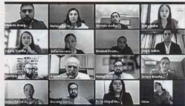
REALIZAN EL FORO EMPRESARIAL 2021 "Resiliencia Empresarial".

Otro de los trabajos fue la implementación de marketing digital para una microempresa textil y comercializadora de bolsos y artículos de moda para dama, ubicada en Tampico. El evento virtual se transmitió los días 14 y 15 de julio de 2021 por YouTube, e incluyó el foro de experiencias con empresarios jóvenes, el foro de egresados de la FCAV y la exposición de incubación de negocios.