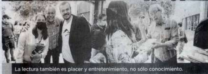
La lectura también es placer y entretenimiento, no sólo conocimiento.