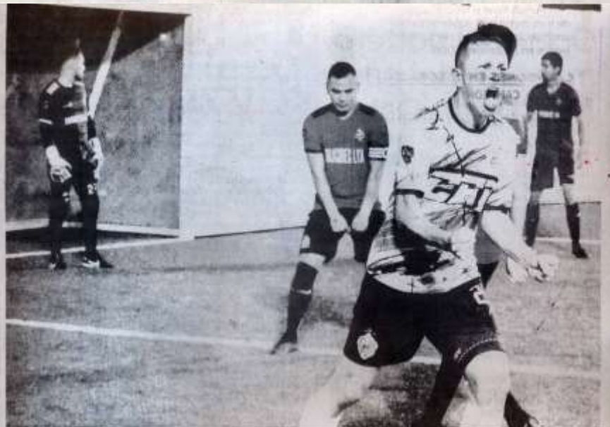
CFR Reynosa, obligado a ganar el juego de vuelta de la semifinal de la Zona Norte de la Liga Nacional de Fútbol Bardash Profesional.