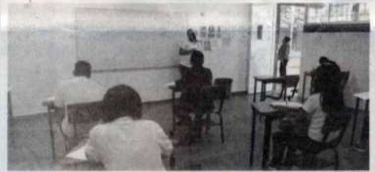
TODAS las unidades académicas de la UAT están listas para el regreso a clases este día.