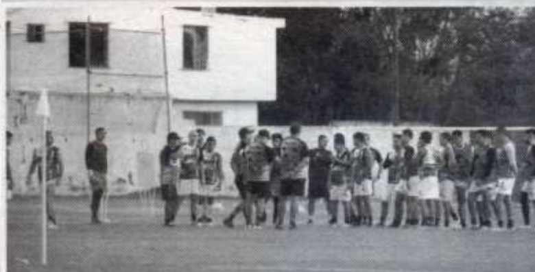
CORRECÁMINOS RECIBIRÁ este día a los Coyotes

Cabe mencionar que la última ocasión que ambos equipos se enfrentaron en Ciudad Victoria fue en la Jornada 6 del Torneo Apertura 2021 y el marcador en aquella ocasión terminó en empate a un gol.