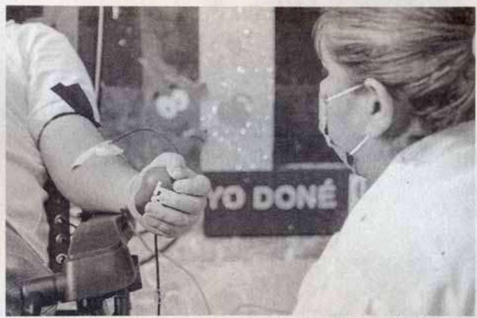
AYER DIO inicio la campaña universitaria de Donación de Sangre 2022-3

La Universidad Autónoma de Tamaulipas (UAT) llevó a cabo el arranque de la campaña universitaria de Donación de Sangre 2022-3, que en conjunto con la Secretaría de Salud realiza para sensibilizar a estudiantes, docentes y administrativos sobre la necesidad e importancia de donar sangre en apoyo a quienes así lo requieran. Tras dos años de suspensión de actividades debido a la pande-