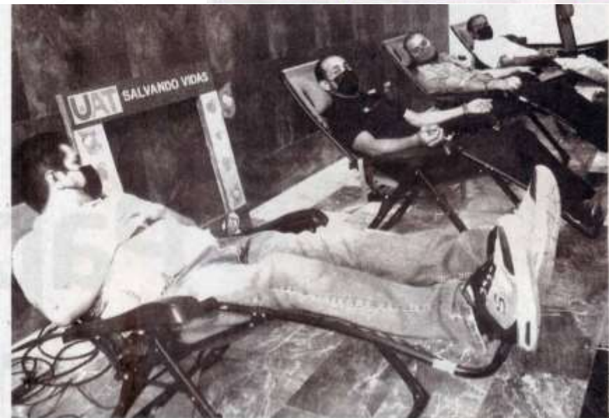
La campaña universitaria de Donación de Sangre 2022-3 se realiza en conjunto con la Secretaría de Salud.