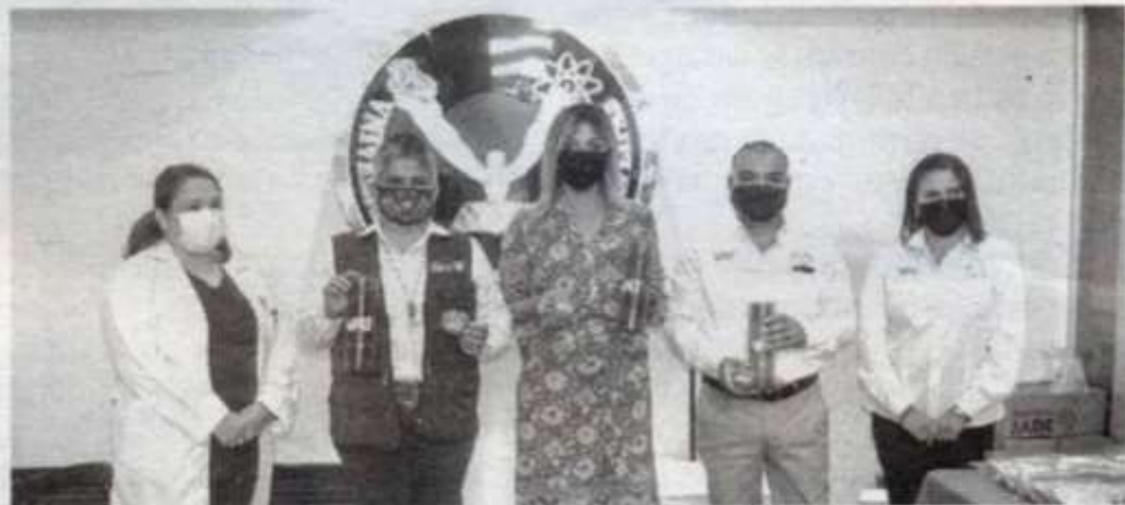
LA UAT dio arranque a la campaña de donación de Sangre 2022-3

Asimismo, la Secretaria de Salud resaltó los trabajos realizados en coordinación entre el sector educativo y el sector salud, en especial a la UAT, pues además de este programa se mantiene cercana la vinculación entre ambas instituciones a través de diversos proyectos y convenios.