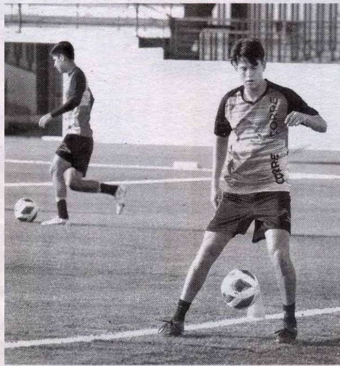
EL JUGADOR victorense quiere que su equipo gane este viernes

Correccaminos disputará la jornada 2 de la "primera vuelta" de la Temporada 2022-2023 de la Liga TDP este viernes 26 de agosto a las 17:00 horas en el Estadio Eugenio Alvizo Porras. Este compromiso, será el primero de esta campaña en calidad de local.