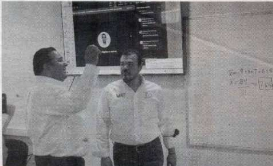
INAUGURÓ EL equipamiento de 21 aulas digitales

En este contexto, se detalló que 31 de las 34 aulas de este plantel (es decir el 91%) han sido remodeladas con pintura, iluminación led, minisplits, pantallas de 65 pulgadas, computadoras, monitores y una cámara Polycom de seis micrófonos inteligentes y sensor de seguimiento para quien imparte la clase.