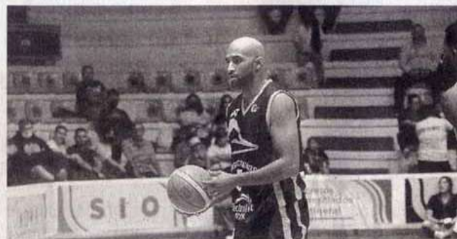
Correbasket regresa a casa para recibir a Soles de Mexicali, en partidos de las jornadas 13 y 14.

Correbasket regresa a casa para recibir a Soles de Mexicali, en partidos de las jornadas 13 y 14 que de jugarán en Tampico, el 1 y 2 de septiembre.