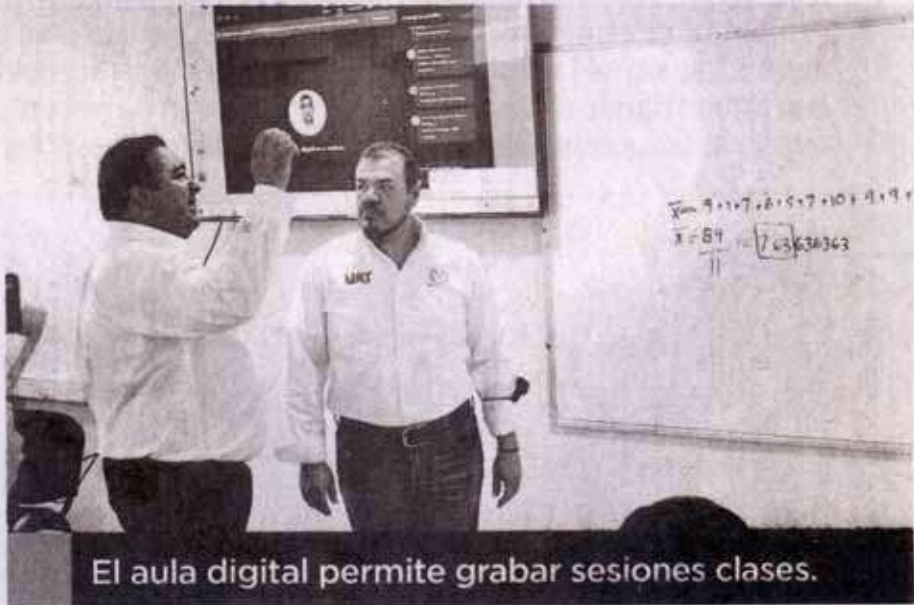
El aula digital permite grabar sesiones clases.