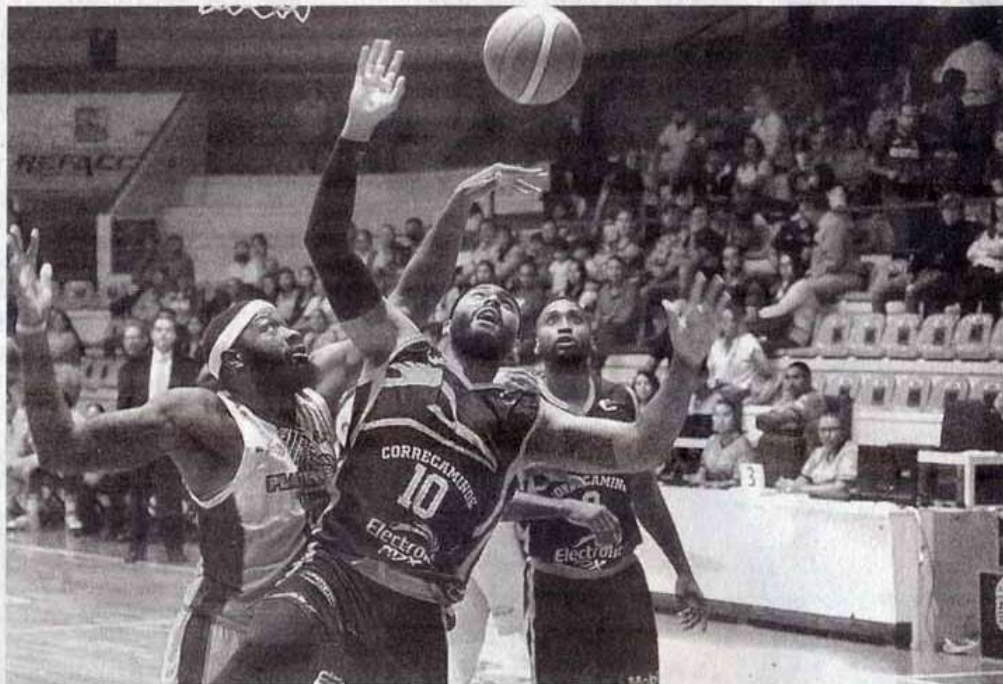
Correbasket UAT salió sin puntería y terminó por ceder la Serie a Plateros de Fresnillo.