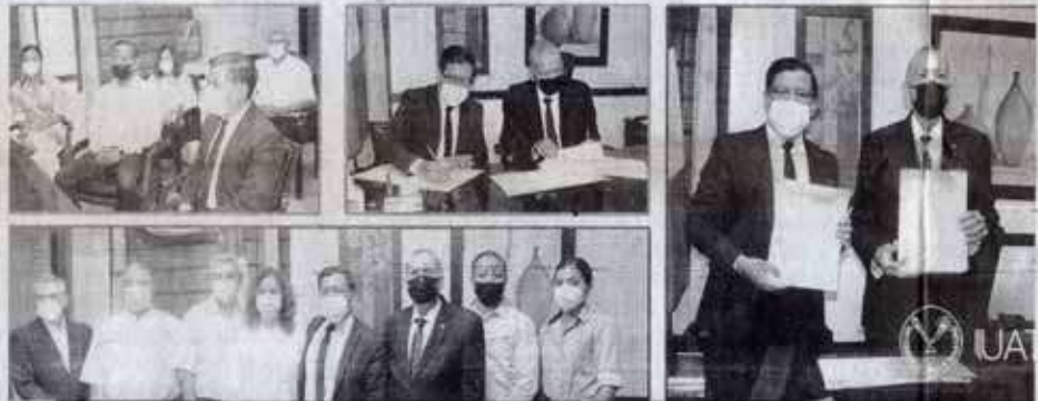
La Facultad de Derecho y Ciencias Sociales Tampico celebró la firma de un convenio de colaboración con la Federación de Abogados Especialistas en Juicios Orales.

FADYCS y la Federación de Abogados Especialistas en Juicios Orales, A.C. firman convenio de colaboración académica