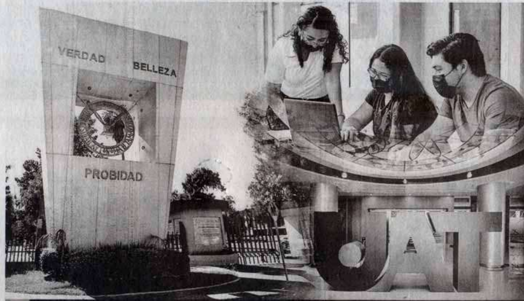
La Universidad ha puesto en marcha el procedimiento para el registro en línea de estudiantes.

Quienes deseen conocer la oferta de programas de estudios con que cuenta la UAT, se les invita a consultar lo antes