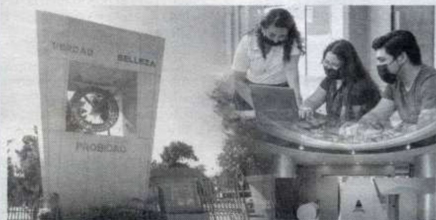
INICIA UAT el proceso de admisión al ciclo escolar 2023-1