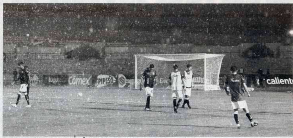
CORRECAMINOS JUGARÁ hoy al medio día ante Cimarrones

Finalmente pasadas las 22:30 horas (tiempo del centro de México), la Liga Expansión Mx dio a conocer que el juego en mutuo acuerdo entre