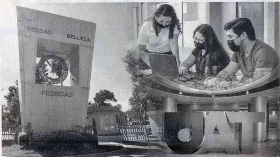
ARRANCA PROCESO DE INSCRIPCIÓN en la UAT

De acuerdo con el calendario escolar 2022, la Institución ha puesto en marcha el procedimiento para el registro en línea de estudiantes que participarán en el proceso de selección correspondiente al próximo período escolar. Con acceso en la liga https://registroaspirantes.uat.edu.mx/ , cada