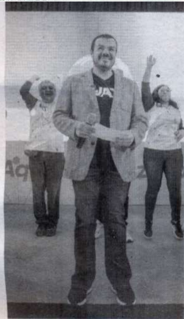
EL RECTOR Guillermo Mendoza se reunió con alrededor de 1,400 estudiantes

Durante el evento, el Rector Guillermo Mendoza Cavazos hizo una exposición dinámica apoyado en videos institucionales, en donde presentó los diferentes programas y servicios que la UAT les ofrece a sus estudiantes.