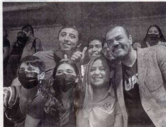
El rector de la UAT, Guillermo Mendoza Cavazos, anunció que en todas las facultades habrá apoyo psicológico para los alumnos.

“De los nueve mil 800 alumnos aspirantes, esperamos estar recibiendo más o menos como ocho mil, ocho mil 500, realmente la matrícula se ha mantenido aun en la pandemia y estamos esperando tener un incremento de un cinco por ciento, a ver si podemos andar rascando los 42, 43 mil estudiantes”, mencionó para concluir.