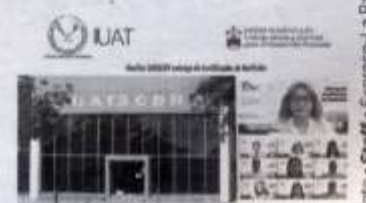
EL CURSO impartido, tiene valor curricular.

Agradeció al Gobierno del Estado de Tamaulipas por su colaboración en este proyecto, y anunció que, a través de la Coordinación de Educación Continua, dependiente de la División de Estudios de Posgrado e Investigación de esta Unidad Académica, se continuará en la labor de ofertar a los estudiantes actividades que alimenten una formación académica de calidad.