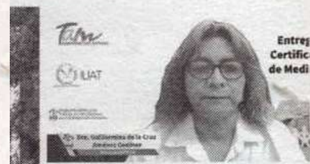
Entreg Certificado de Medi