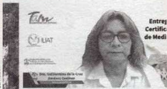
Entreg Certificado de Mediador