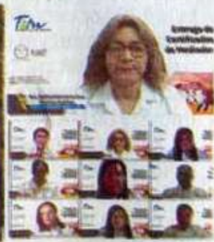
Alumnos de la UAT reciben certificación como mediadores en materia familiar.