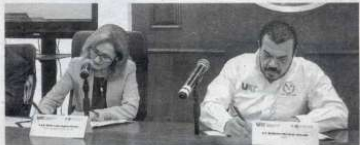
SUSCRIBE CONVENIO la UAT con el IEST Anáhuac, para impulsar una colaboración amplia

La Universidad Autónoma de Tamaulipas (UAT) y el Instituto de Estudios Superiores de Tamaulipas (IEST) de la Red de Universidades Anáhuac firmaron un convenio marco de colaboración que fortalecerá el trabajo conjunto en materia de salud, además de abrir oportunidades de generar programas específicos en las áreas de investigación, docencia, posgrado, servicio social, entre otras.