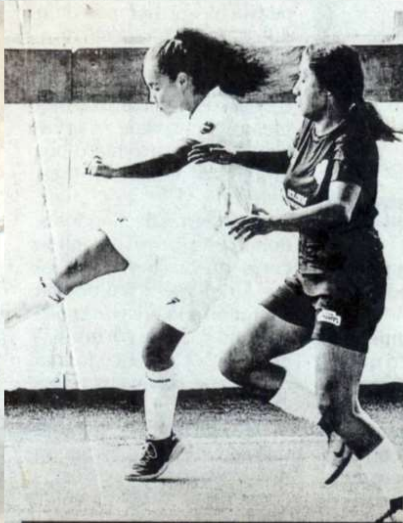
La Selección UAT se medirá a Juanchos TM Femenil en el duelo de repechaje.

El equipo que gane avanzará a los playoffs así que la cancha estará que arde en punto de las 17:00 horas. Cabe resaltar que ambas escuadras se vieron las caras en la jornada 12 del torneo regular donde la Selección UAT sacó la casta y vino de atrás para ganar por marcador de 7-6.