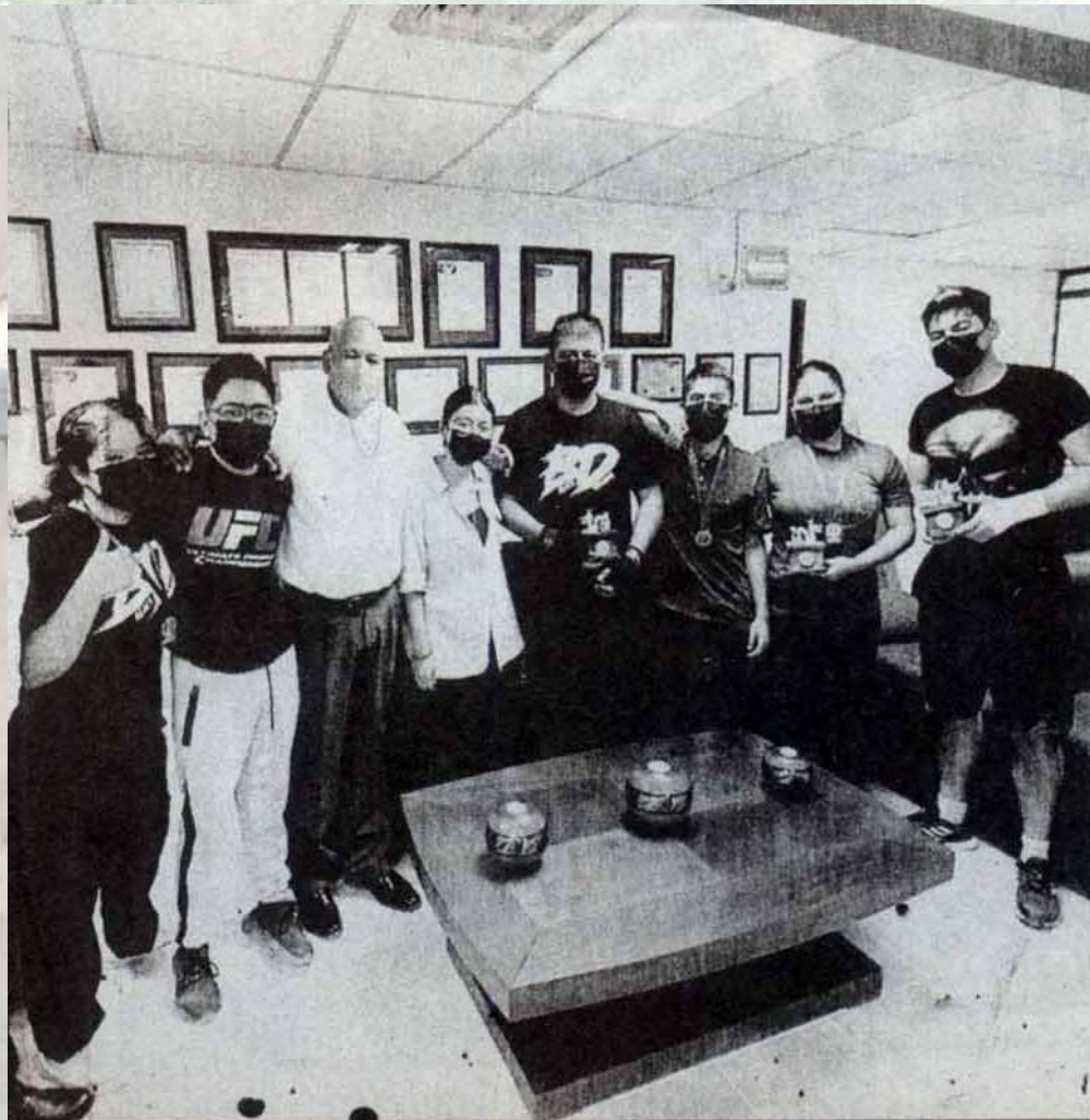
Seleccionados UAT suben al podio en el Torneo Abierto de Artes Marciales.