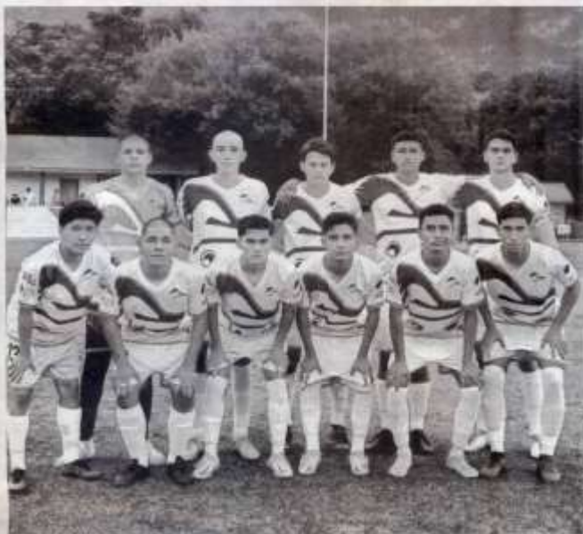
CORRECAMINOS LOGRÓ un punto importante de visitante

VICERRECTORÍA DE VINCULACIÓN Y PROMOCIÓN SOCIAL VICERRECTORÍA DE INVESTIGACIÓN Y DESARROLLO TECNOLÓGICO VICERRECTORÍA DE ADMINISTRACIÓN Y FINANZAS VICERRECTORÍA DE ASISTENCIA ESTUDIANTIL VICERRECTORÍA DE EXTENSIÓN Y SERVICIO SOCIAL VICERRECTORÍA DE GESTIÓN Y CALIDAD VICERRECTORÍA DE PLANEACIÓN Y EVALUACIÓN VICERRECTORÍA DE PROMOCIÓN Y RELACIONES PÚBLICAS VICERRECTORÍA DE RECURSOS HUMANOS VICERRECTORÍA DE TRABAJO SOCIAL VICERRECTORÍA DE VINCULACIÓN Y PROMOCIÓN SOCIAL VICERRECTORÍA DE INVESTIGACIÓN Y DESARROLLO TECNOLÓGICO VICERRECTORÍA DE ADMINISTRACIÓN Y FINANZAS VICERRECTORÍA DE ASISTENCIA ESTUDIANTIL VICERRECTORÍA DE EXTENSIÓN Y SERVICIO SOCIAL VICERRECTORÍA DE GESTIÓN Y CALIDAD VICERRECTORÍA DE PLANEACIÓN Y EVALUACIÓN VICERRECTORÍA DE PROMOCIÓN Y RELACIONES PÚBLICAS VICERRECTORÍA DE RECURSOS HUMANOS VICERRECTORÍA DE TRABAJO SOCIAL