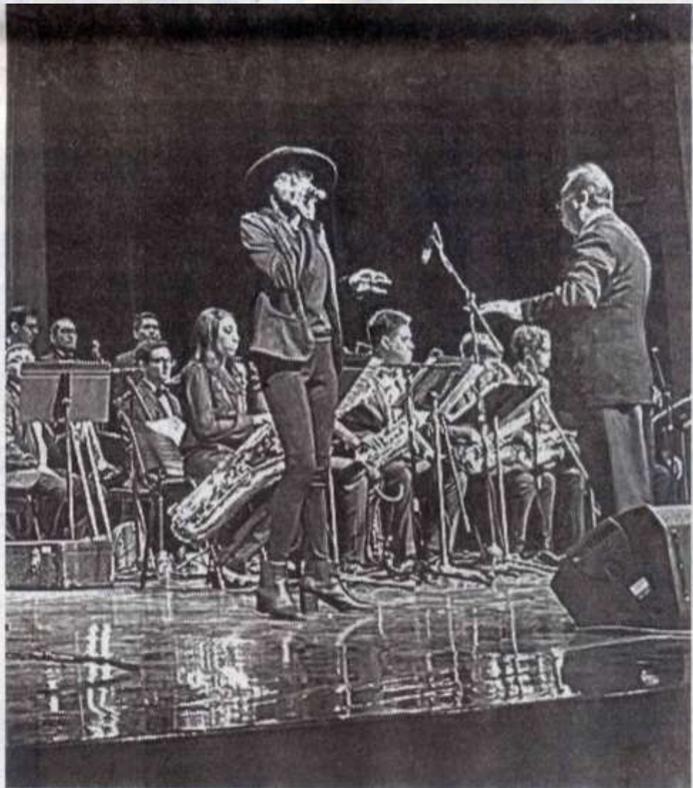
CELEBRA LA UAT la quinta edición del Festival Cultural Universitario "CultivArte".

En la zona norte, las actuaciones de los respectivos grupos de danza folclórica en la Unidad Académica Multidisciplinaria Valle Hermoso y de música versátil en la Unidad Académica Multidisciplinaria Reynosa Rodhe. Para la zona sur, la "Serenata romántica" con la Rondalla UAT, la participación de la Big Band de la Facultad de Música y Artes, del Ballet Folklórico Yacatecutli y, en el evento de clausura, la agrupación Tempus Quartet.