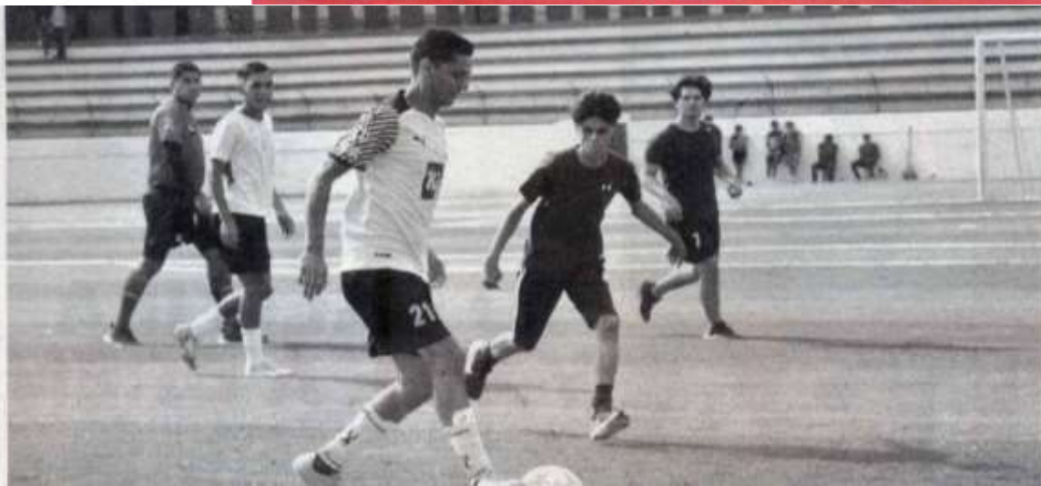
Arredas • Expreso-La Razón