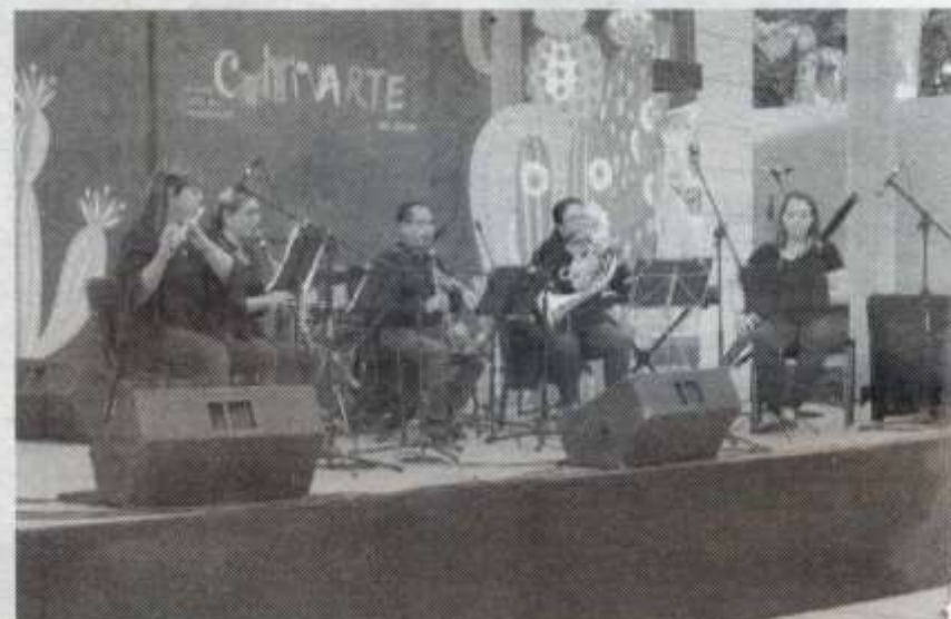
CELEBRAN CON éxito festival universitario

Como parte de las agrupaciones y artistas que se programaron en este festival, en la zona centro se encuentran el grupo musical 6PM, el Quinteto de Alientos, el Ballet Folklórico de la UAT, la Rondalla a Voces, Voces UAT, Escala Musical y Son UAT; así integrantes de los talleres artísticos que se imparten en esta casa de estudios.