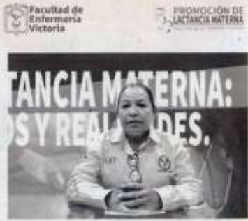
LA CONFERENCIA se realizó vía virtual