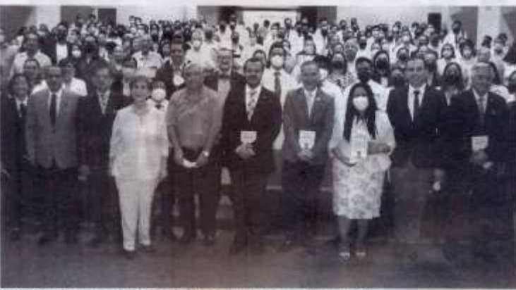
PRESENTAN en la UAT libro 'Historias de vida durante la pandemia'

VICERRECTORÍA DE CALIDAD, BELLEZA, PROSPERIDAD