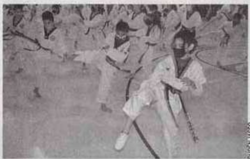
Niños y jóvenes de Tamaulipas y de Nuevo León estuvieron presentes en esta actividad.