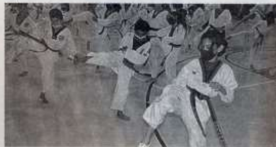
MUY FRUCTÍFERO resultó el campamento que se realizó en el Gimnasio Multidisciplinario de la UAT.