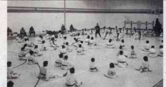
Un éxito resultó el campamento.