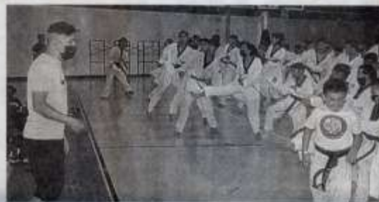
MÁS DE UN CENTENAR de niños y jóvenes universitarios se dieron cita en el campamento.