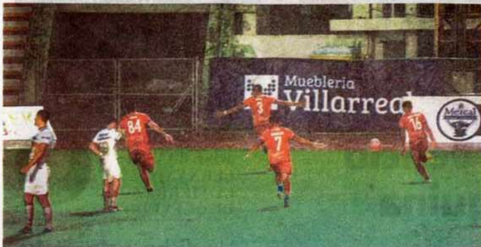
Su filial recibirá a la Jaiba Brava en el Eugenio Alvizo Porras.