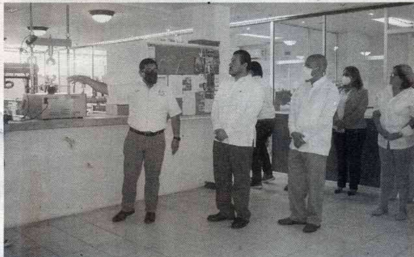
ENCABEZA RECTOR evaluación de avances en la planeación estratégica institucional