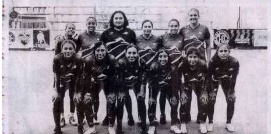
La selección UAT fue eliminada por las Juanchas del campeonato femenino de la Liga Nacional de Fútbol Bardas Profesional.