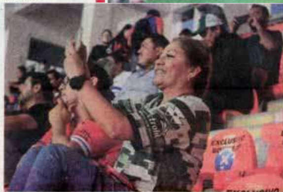
La afición por fin pudo festejar.