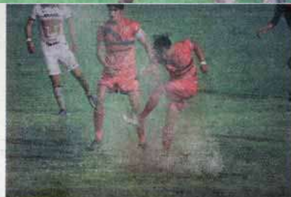
Todo el partido se celebró bajo la lluvia.