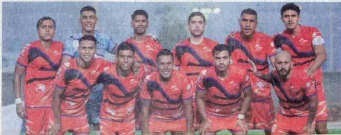
Correcaminos se reencontró con el triunfo