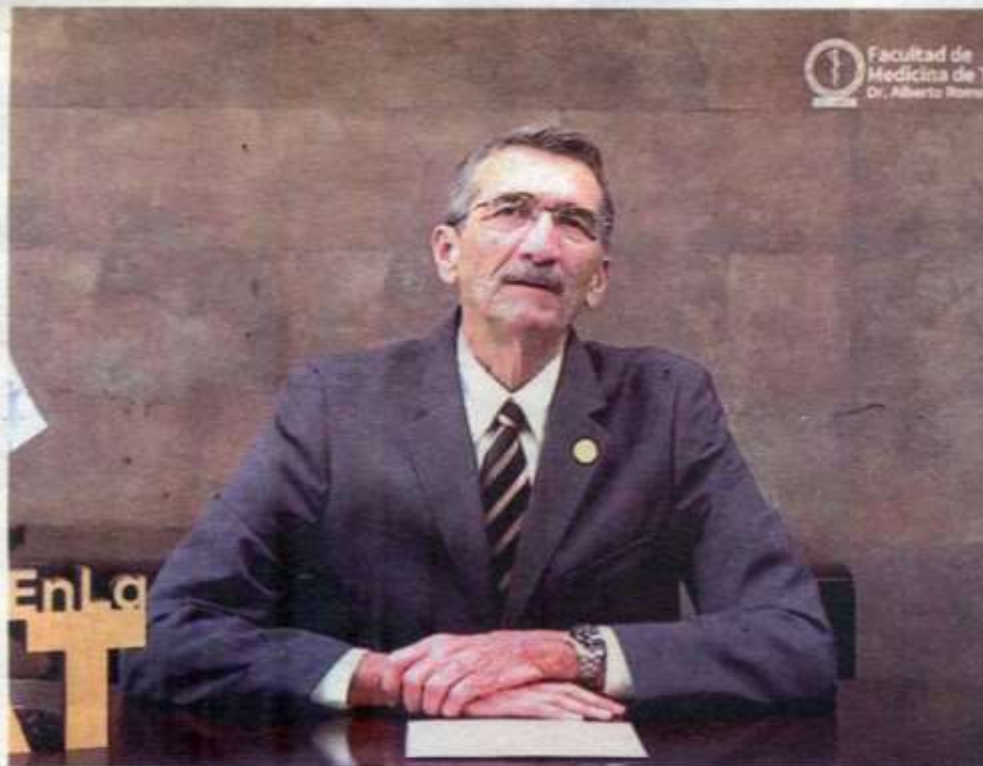
Facultad de Medicina de Tampico Dr. Alberto Romo Caballero