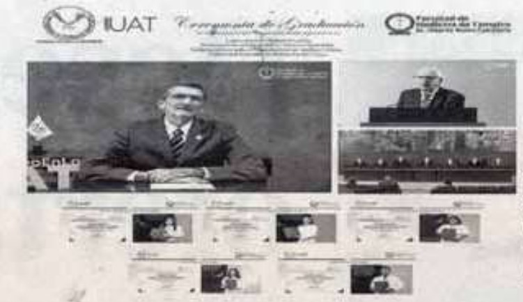
ENCABEZA el rector, graduación de facultad de medicina de la UAT Tampico.

DE LA CARRERA DE MÉDICO CIRUJANO Y PROFESIONAL ASOCIADO EN LAS ÁREAS DE ADMINISTRACIÓN BIOMÉDICA, LABORATORISTA DE ANÁLISIS CLÍNICOS Y REHABILITACIÓN FÍSICA