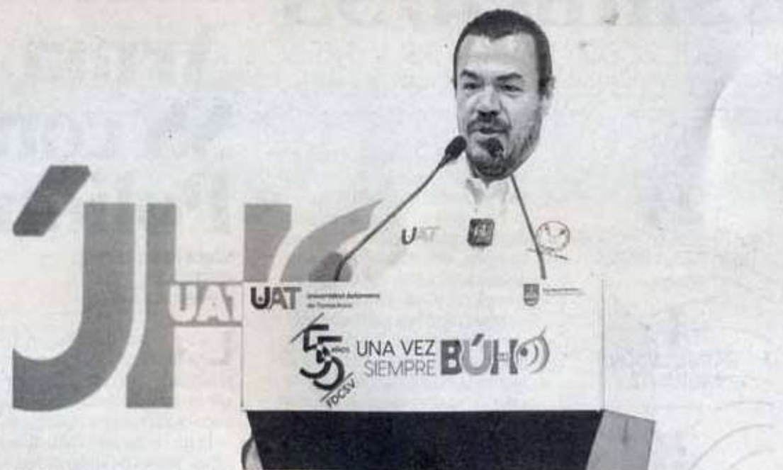
INAUGURA RECTOR, Feria Estatal de Proyectos e Iniciativas Ciudadanas