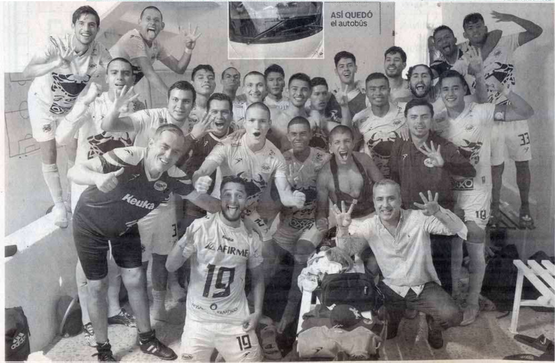
ASÍ QUEDÓ el autobús