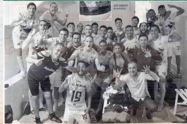
ASI QUEDÓ EL AUTOBÚS