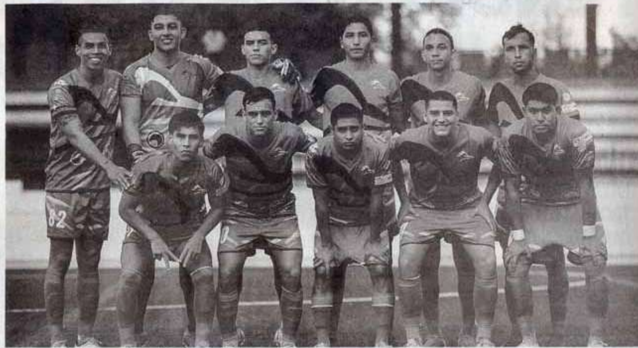
Correcaminos Premier no pudo de local ante el Tampico Madero.