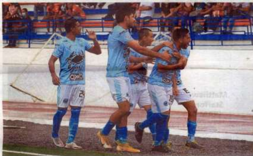
La escuadra celeste permanece como superlíder en la categoría.

Respondieron los locales a través de una media vuelta en el área de Eduardo Banda, para sacarse está genialidad y le permitió al Corre competir al igualar los cartones.