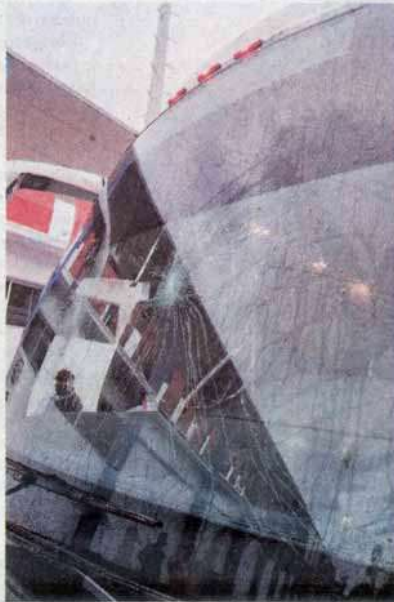
Aficionados del Correccaminos apedrearon la cabina

Tampico por su parte llegó a 11 unidades en lo más alto del grupo.