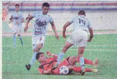
Correccaminos cayó en el clásico Tamaulipeco.