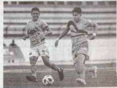
Ambos equipos dejaron todo en la cancha, a pesar de la lluvia.