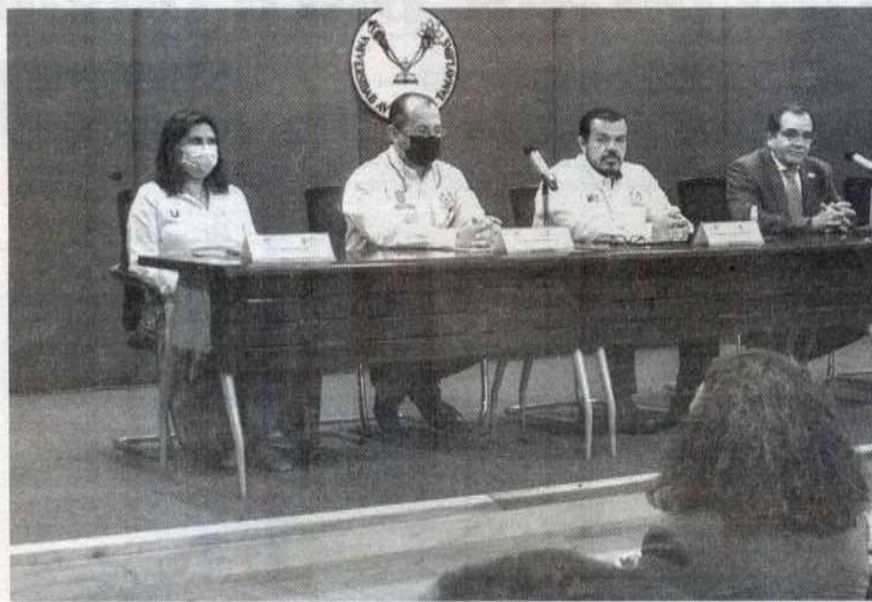
PONEN en marcha en la UAT, ciclo de conferencias