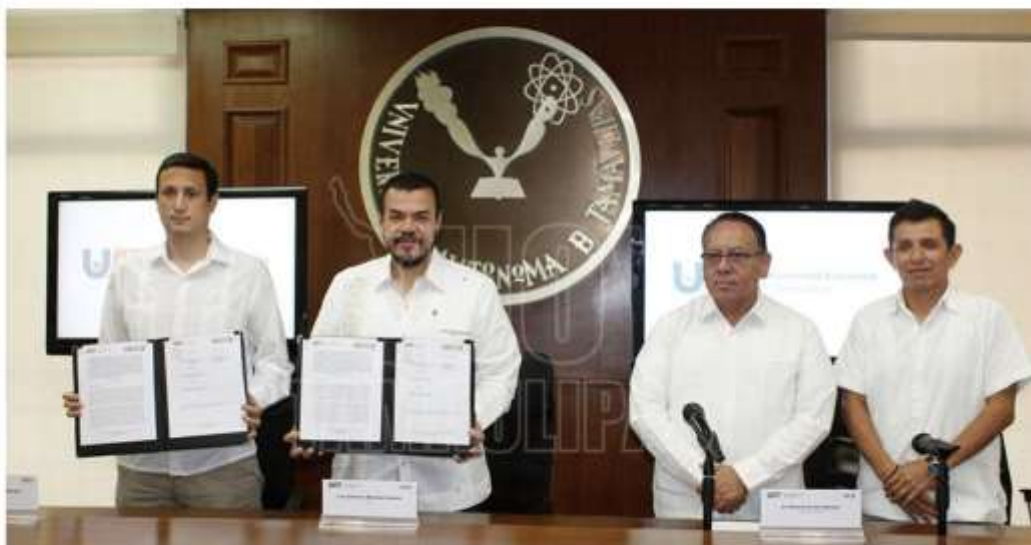
La Universidad Autónoma de Tamaulipas (UAT) y el Consejo de Instituciones Empresariales del Sur de Tamaulipas (CIEST) establecieron un convenio de colaboración

Por: HT Agencia El Día Martes 07 de Junio del 2022 a las 17:42