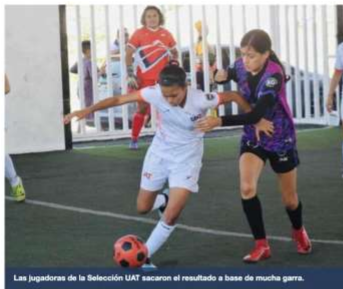
Las jugadoras de la Selección UAT sacaron el resultado a base de mucha garra.