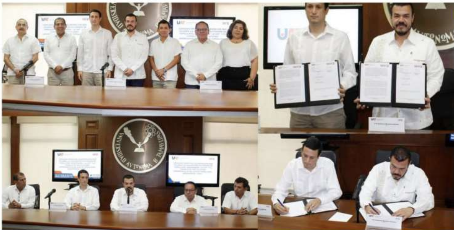
La UAT y el CIEST fortalecen la vinculación academia-empresa en el sur de Tamaulipas

INICIO LA CIUDAD LA REGIÓN NACIONAL INTERNACIONAL VIRAL STILO ESCENARIOS DEPORTES TECNOLOGÍA OPINIÓN CLASIFICADOS