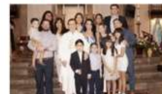
Recibe el sacramento de la