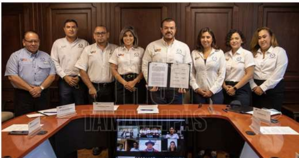
La Universidad Autónoma de Tamaulipas (UAT) firmó un convenio marco de colaboración con la fundación UNIFRANZ

Por: HT Agencia El Día Viernes 12 de Agosto del 2022 a las 16:39