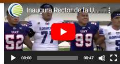
Inaugura Rector ciclo escolar de la UAT y recibe a la nueva generación de estudiantes