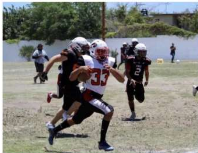
Los Búfalos vencieron 6-0 a los Cuernos Largos en la Semana 2 de la LUFAUAT.