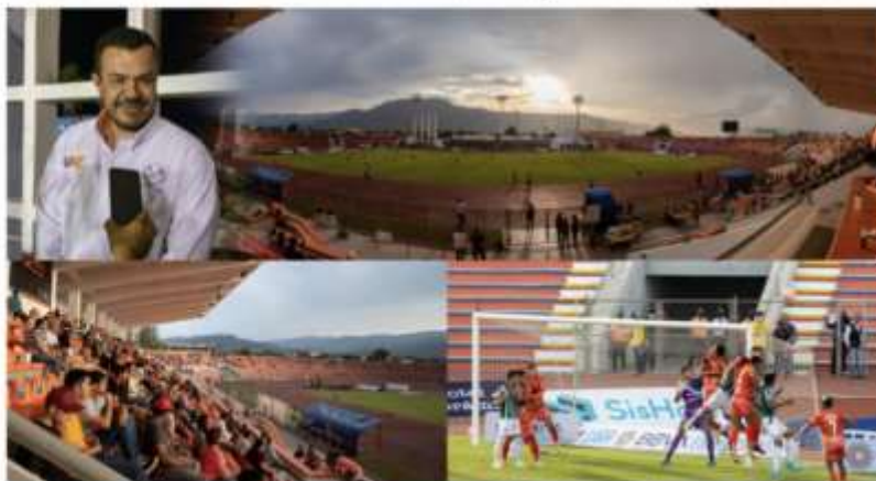
Ciudad Victoria, Tam.